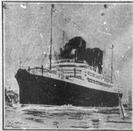
Le nouveau navire "Andania".

The Cunard S. S. Co., Ltd. LIVERPOOL, Pier Head. LONDRES, 51 Bishopgate, E.C. 29 Cockspur St. S. W. PARIS, 37 Boul. des Capucins.