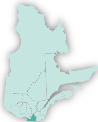
Figure 1 : Localisation de la Montérégie sur la carte du Québec

La Montérégie est une région administrative québécoise située au sud du Québec. Elle est bordée au nord par le fleuve Saint-Laurent et la rivière Outaouais, au sud par les États-Unis, à l'est par les régions administratives du Centre-du-Québec et de l'Estrie et à l'ouest par la province de l'Ontario.