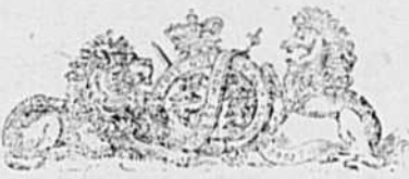
CONTRAT DE LA MALLE

L'insuccès du prochain emprunt pourrait perpétuer le grand malaise qui règne aujourd'hui, et croit-on que ce serait pour le bien de chacun de nous? Hâtons-nous donc de faire notre part et n'allons pas manquer l'éclat d'une bonne affaire. D-50