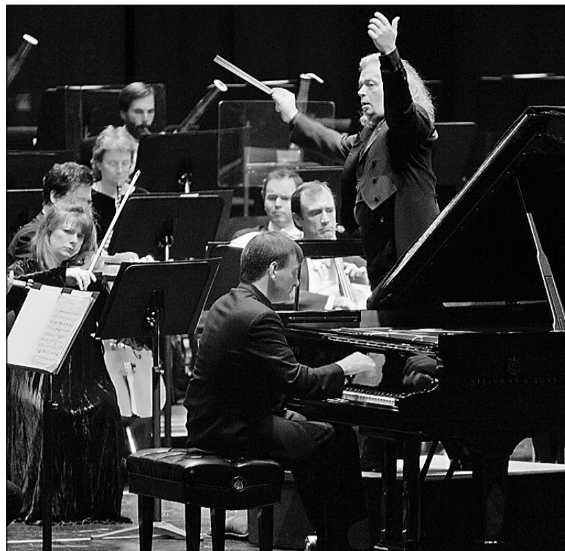
Le pianiste Stephen Hough et le chef invité Claus Peter Flor. Reprise à l'OSM dimanche, 14h30.

ORCHESTRE SYMPHONIQUE DE MONTRÉAL. Chef invité : Claus Peter Flor. Soliste : Stephen Hough, pianiste. Mardi soir, salle Wilfrid-Pelletier de la Place des Arts (« Grands Concerts »). Reprise dimanche, 14 h 30 (« Dimanches en musique »). Programme : Le Tombeau de Couperin (1914-17) - Ravel Concerto pour piano et orchestre no 2, en sol mineur, op. 22 (1868) - Saint-Saëns Symphonie no 15, en la majeur, op. 141 (1971-72) - Chostakovitch