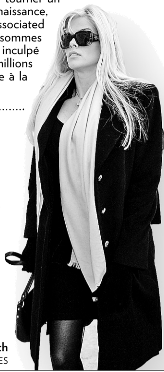
Anna Nicole Smith