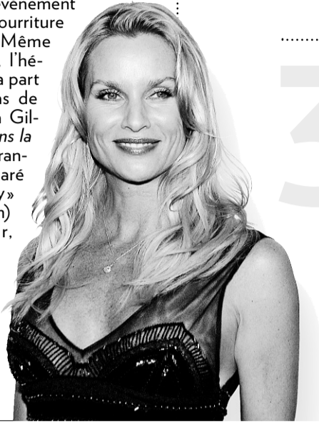
Nicollette Sheridan

Même si elle adore son chien, Oliver, Nicollette Sheridan a refusé tout net de goûter sa pâtée à l'occasion d'une journée hommage destinée à renforcer les liens entre les maîtres et leur chien en partageant leur repas et à laquelle ont participé de nombreuses célébrités. « On n'est pas dans Koh-Lanta! » s'est justifiée l'actrice de Beautés désespérées en refusant la gamelle de nourriture pour chien qu'on lui tendait, lors de l'événement organisé par le fabricant de nourriture pour chiens Natural Balance. Même refus de la part de Linda Blair, l'héroïne de L'exorciste , qui a pour sa part prétexté être végétarienne. Pas de souci en revanche pour Melissa Gilbert, star de La petite maison dans la prairie , ni pour l'acteur James Farentino. Le 21 octobre a été déclaré « Dine With Your Dog Day » (Journée du repas avec son chien) par Arnold Schwarzenegger, gouverneur de Californie, et ses homologues du New Jersey, du Connecticut, du Rhode Island, du Nebraska et de Virginie-Occidentale. Édifiant!