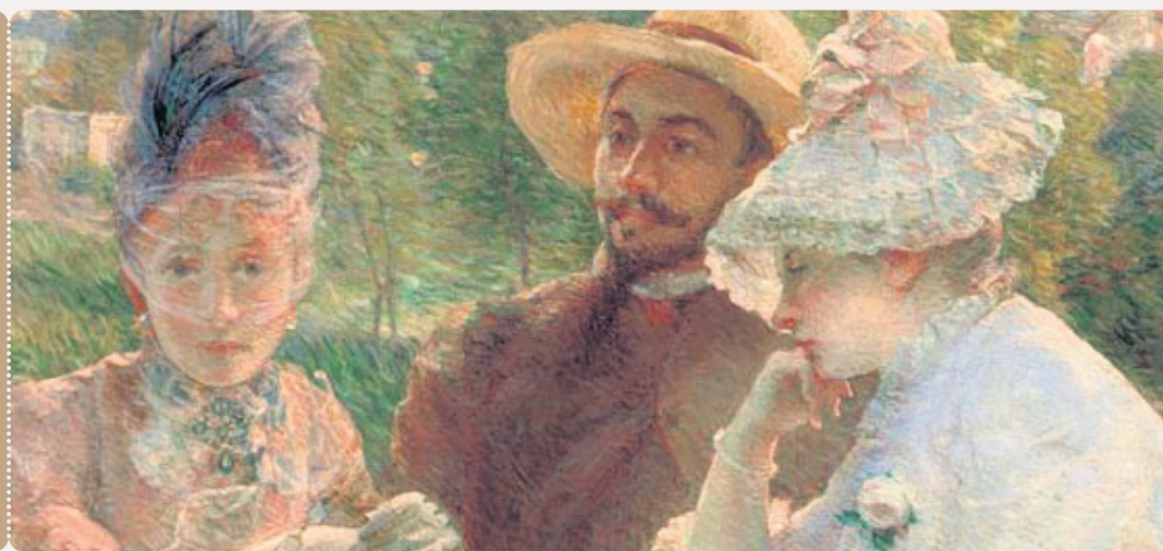
MADRE BRACQUEMOND, SUR LA TERRASSE À SÈVRES (DÉTAIL), 1880. HUILE SUR TOILE, 88 X 115 CM. ASSOCIATION DES AMIS DU PETIT PALAIS DE GENÈVE • STUDIO MONIQUE BERNAZ, GENÈVE.

FORFAIT « ESCAPADE AU MUSÉE » À PARTIR DE 166$ 1 877 838-6972 • LOEWSLECONCORDE.COM