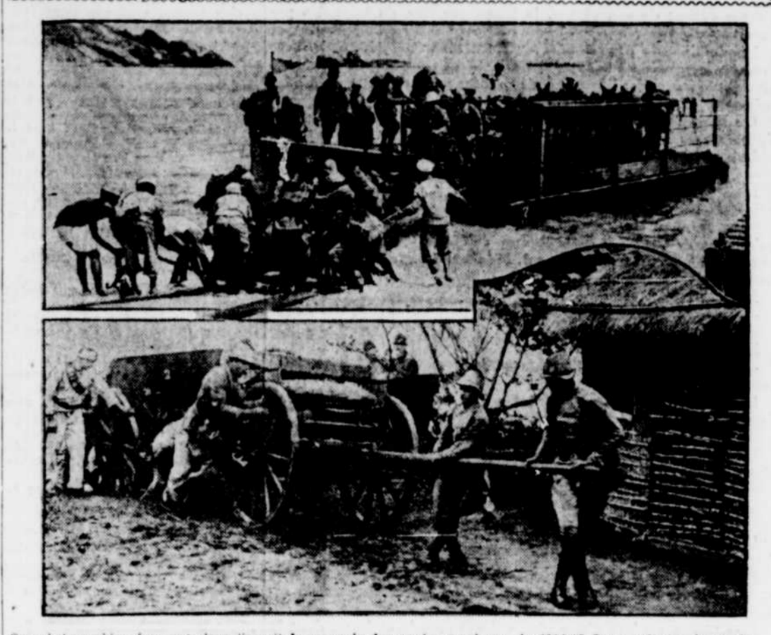
Ces photographies évoquent dans l'esprit le souvenir des années tragiques de 1914-18. On y voit (en haut) des troupes fédérales débarquant du matériel sur une plage près de Rio de Janeiro, et, en bas, une autre escouade se hâtant de mettre une batterie en position afin de tenter d'arrêter la marche victorieuse des rebelles.

Le gouvernement MacDonald a une majorité de 30 voix