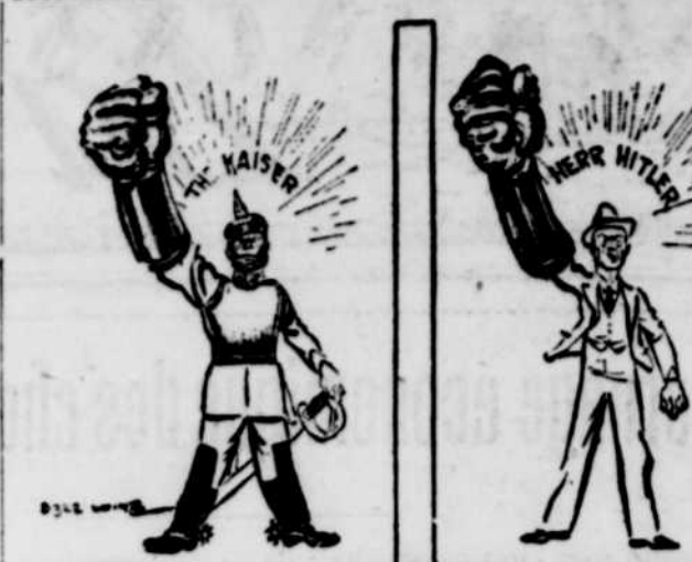
Jadis : La crainte de l'Europe.— Aujourd'hui la crainte de l'Allemagne. The Record, Glasgow, Ecosse.