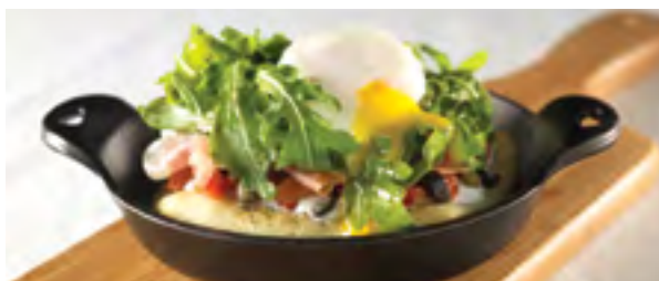
Pizza en caquelon