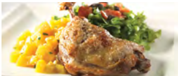
Cuisse de canard confite et duo de salades