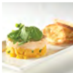
Rillettes de saumon fumé et coriandre