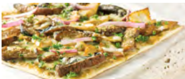
Pizza aux 7 champignons