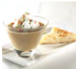
Velouté de champignons