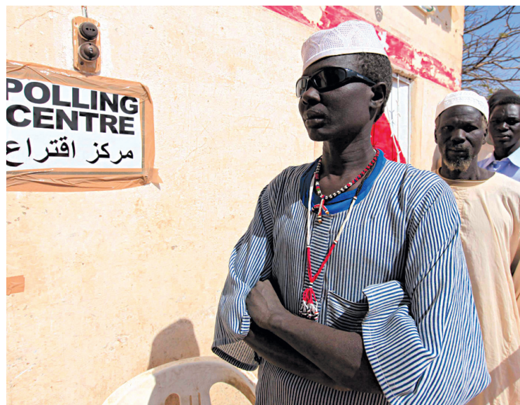
Des Soudanais du sud devant un bureau de scrutin hier, à Dilin.

Les chefs de la tribu Dinka Ngok accusent Khartoum d'armer les miliciens Misseriya, avec lesquels ont eu lieu des af-