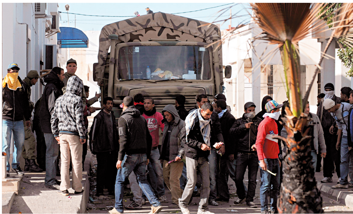
Des manifestants ont encerclé un camion de l'armée hier, à Regueb.

Désormais, la capitale Tunis, jusque-là peu touchée par les manifestations, est entrée dans la danse. Un étudiant aurait été blessé et huit arrêtés sur le campus Al-Manar, près de la capitale. Des marches auraient aussi été organisées sur le campus de la Manouba, dans les quartiers du Bardo, de l'Ariana, de Ben Arous. Tunis mais aussi Sfax, Sousse, Nabeul, c'est-à-dire les grandes villes côtières et touristiques, sont gagnées par la contestation. En plus de Kairouan, de Redeyef et du centre du pays, où tout a commencé.