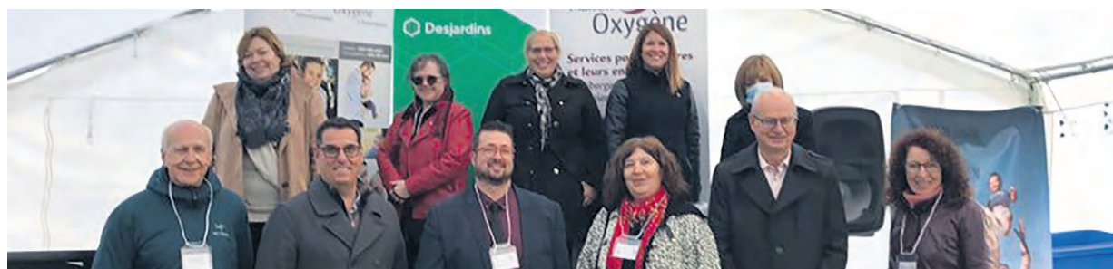
Les Maisons Oxygène offrent des services d'hébergement et de soutien aux pères vivant divers types de difficultés.