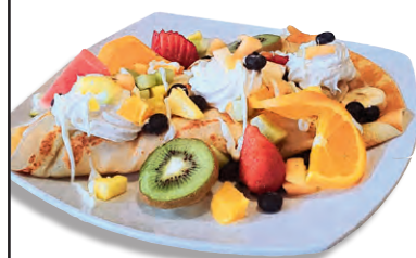
Crêpes et fruits