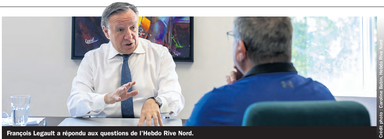
François Legault a répondu aux questions de l'Hebdo Rive Nord.

Un autre dossier est celui de l'agrandissement de l'hôpital Pierre-Le Gardeur. Le projet permettra l'ajout de 246 lits de courte durée et la mise à niveau des unités de soins et du plateau technique, notamment. Le projet s'inscrit dans la volonté du gouvernement d'augmenter le nombre de lits, d'offrir les meilleures infrastructures possibles en matière de soins et de services de santé et de compléter une offre de service de qualité, sécuritaire à la population. Pour ce faire, une tour de 12 étages liée aux autres pavillons par