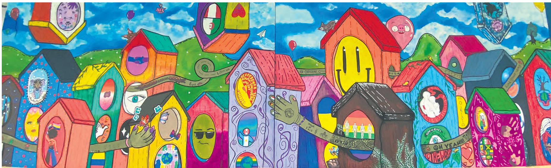
L'œuvre finale est colorée et éclatée, à l'image des élèves du Collège de l'Assomption.