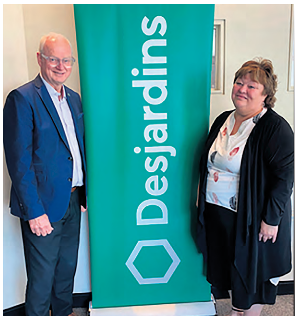
La Caisse Desjardins Pierre-Le Gardeur soutient l'organisme Fin à la faim... depuis plusieurs années.