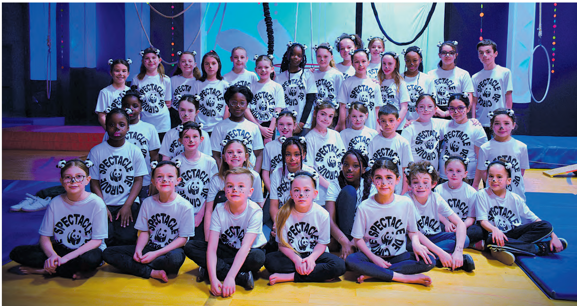
Les jeunes artistes de la troupe de cirque de l'école Pie-XII.