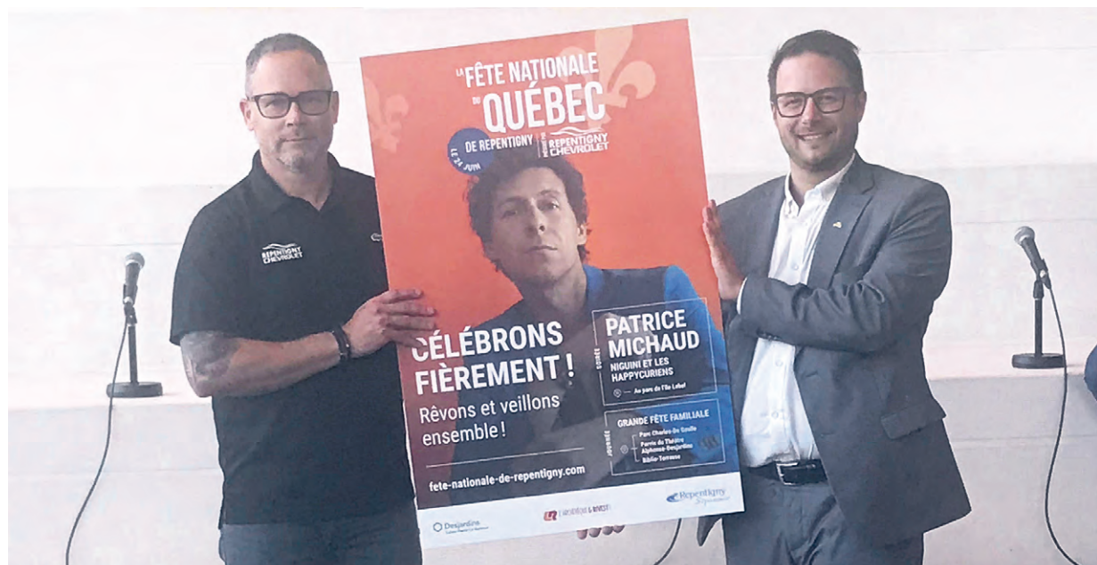
Les organisateurs ont dévoilé l'affiche de la fête nationale.

Parmi les événements phares, ajoutons la Boîte à Musique Desjardins sur le parvis du Théâtre et au parc Jean-Claude-Crevier, ainsi que la Fête au Petit Village. Pour enrichir l'expérience, il sera possible de parcourir l'histoire de la Ville en participant à l'un des tours guidés de l'Espace culturel, d'apprécier des installations artistiques uniques, comme des lanternes illuminées, d'assister à une série de spectacles jazz tous les vendredis, et de parcourir une installation interactive sur l'univers musical des Cowboys Fringants. Une offre commerciale et gourmande viendra compléter à merveille l'escapade.