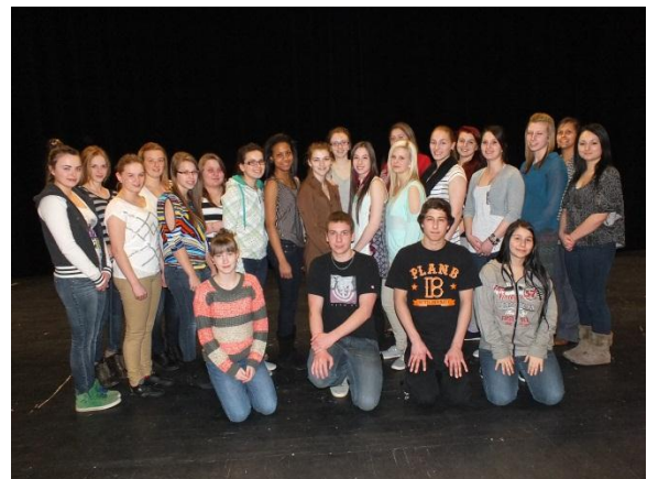
Troupe Les mâles dominés