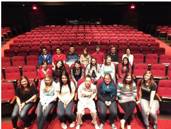
Troupe La meute

Découvrez l'art de Shakespeare dans un monde surprenant avec des personnages colorés, uniques et attachants.