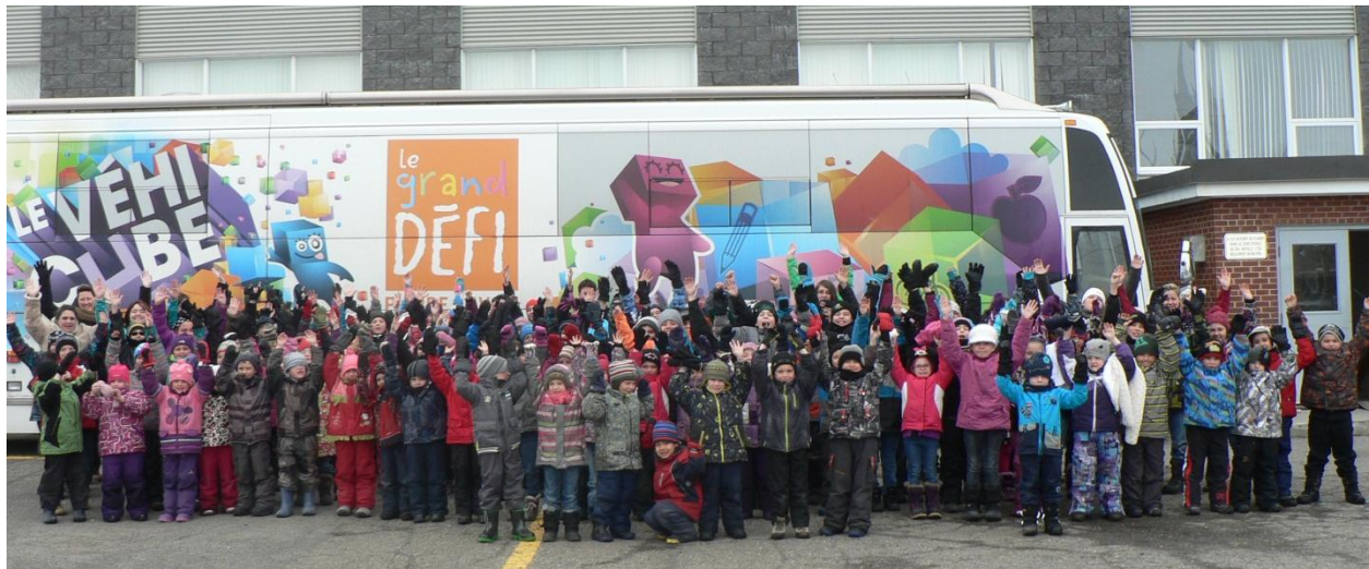
Élèves de l'école des Cheminots

http://www.flickr.com/photos/granddefi/sets/72157633200729783/