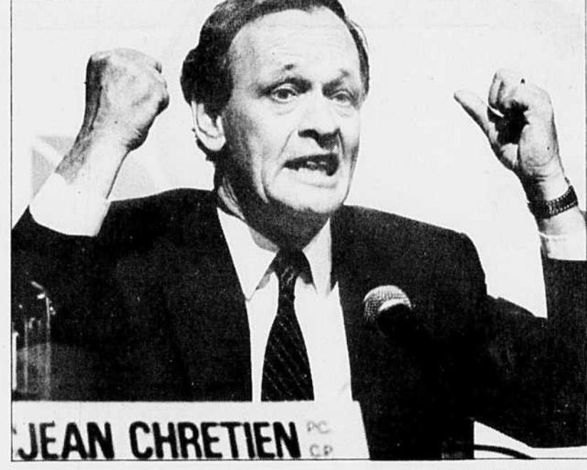
JEAN CHRETIEN PC Jean Chrétien a dû se débattre, hier, devant 2000 militants libéraux à Montréal, pour expliquer sa dernière et singulière position sur Meech.