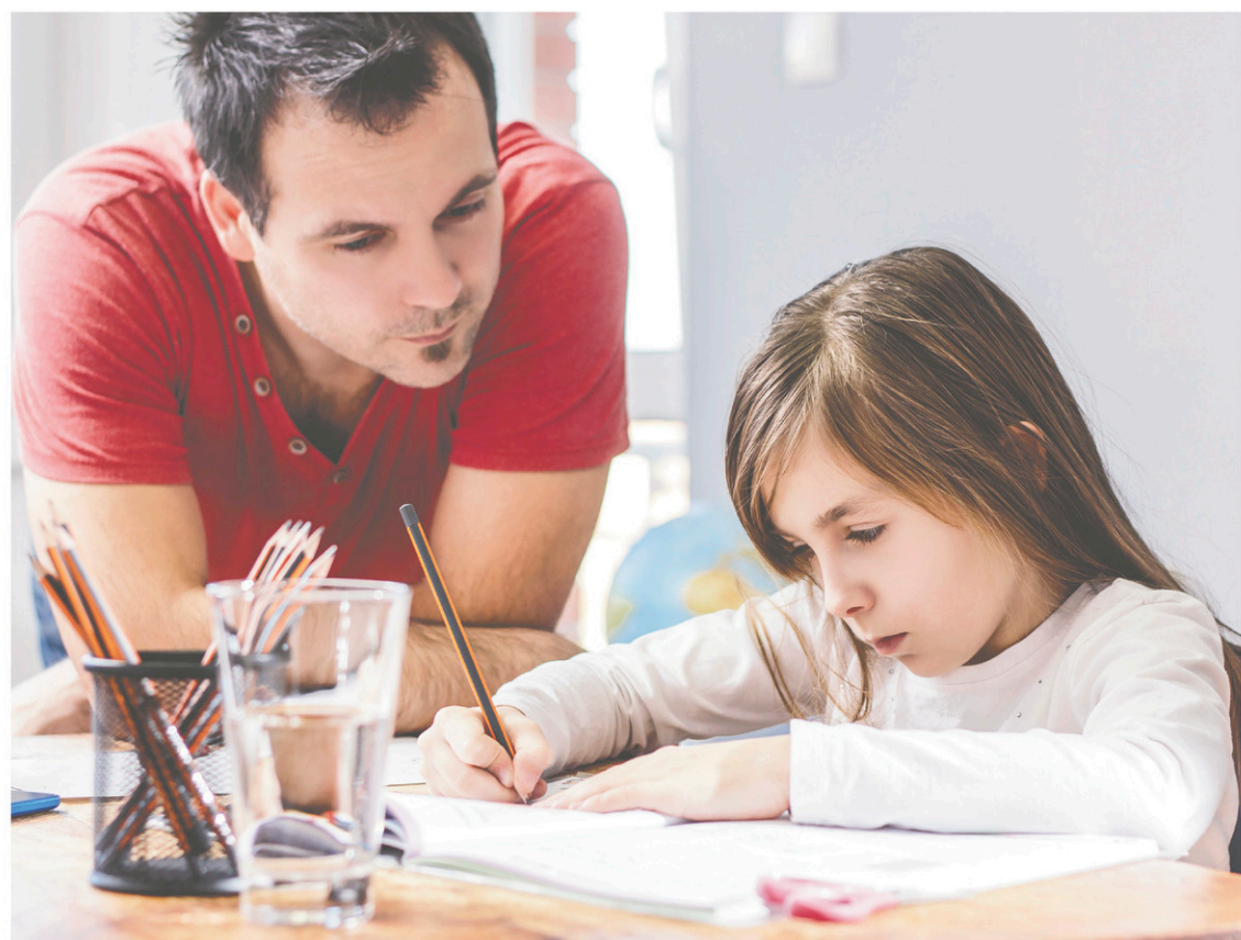
Les maisons des familles aident les parents de 135 000 familles par année à prendre conscience de l'importance et de l'impact qu'ils ont sur le parcours éducatif de leur enfant.

«Mais c'est rare qu'un parent nous parle de prime abord de ses problèmes de littératie, sou-