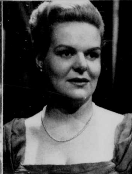
Maureen Forrester contralto