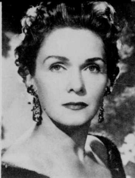
Elisabeth Schwarzkopf soprano