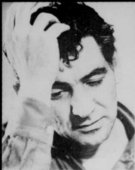
Leonard Bernstein chef d'orchestre