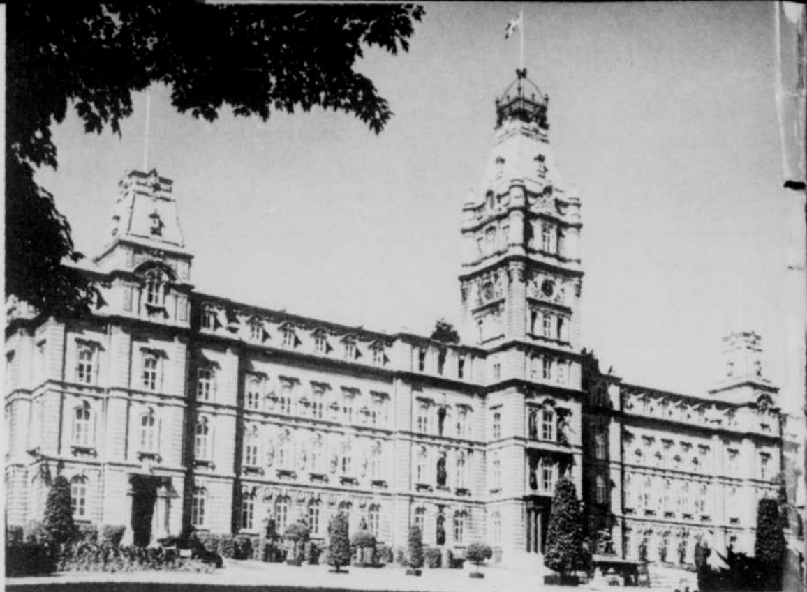
L'édifice de la Législature provinciale, à Québec.

Ce reportage passera, à la télévision, de 2 h. 30 à 4 heures approximativement. Réalisation: Jean-Maurice Laporte. À la radio, il sera entendu de 2 h. 45 à 4 heures environ. Réalisation: Guy Dumais. Commentateurs: Charles Dussault et Paul-Émile Tremblay.