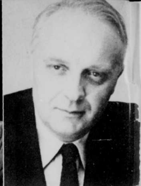
Robert Casadesu pianiste