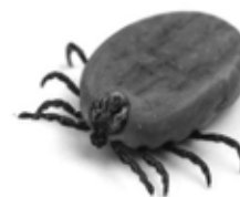
Après le repas de sang

Lorsqu'un être vivant au sang chaud passe près d'elles, les tiques se laissent amoureusement tomber dessus et attaquent par morsure. Ce ne sont pas TOUTES les tiques qui transmettent la maladie de Lyme. Mais, avec la saison de la chasse qui approche, les «Buffalo Bill» de Saint-Alexandre sont à risques. Les amateurs de promenades (autant les humains que les chiens) doivent eux aussi prendre leurs précautions.