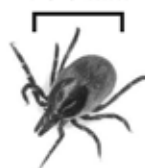
Avant le repas de sang