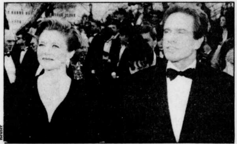
En nomination pour l'Oscar du meilleur acteur, Warren Beatty arrive à la cérémonie accompagné de son épouse et co-vedette de son film, « Bugsy », Annette Bening.

Cette année, l'éviction de Barbra Streisand de la sélection pour la meilleure réalisatrice a déchainé les accusations de machisme et fait oublier celle du jeune metteur en scène noir John Singleton (Boyz N The Hood).