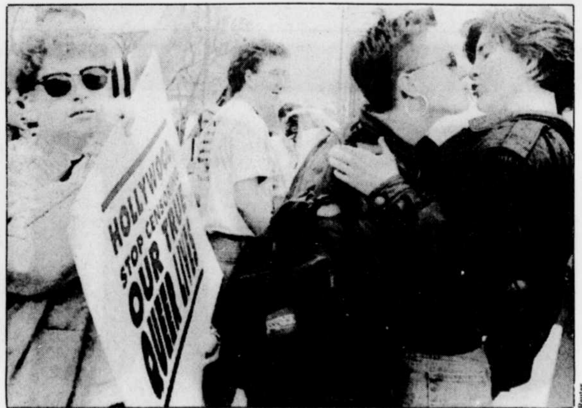
Deux homosexuelles s'embrassent durant la manifestation devant le « Dorothy Chandler Pavillon » où avait lieu la remise des Oscars. Les manifestants n'ont finalement pas perturbé la cérémonie.