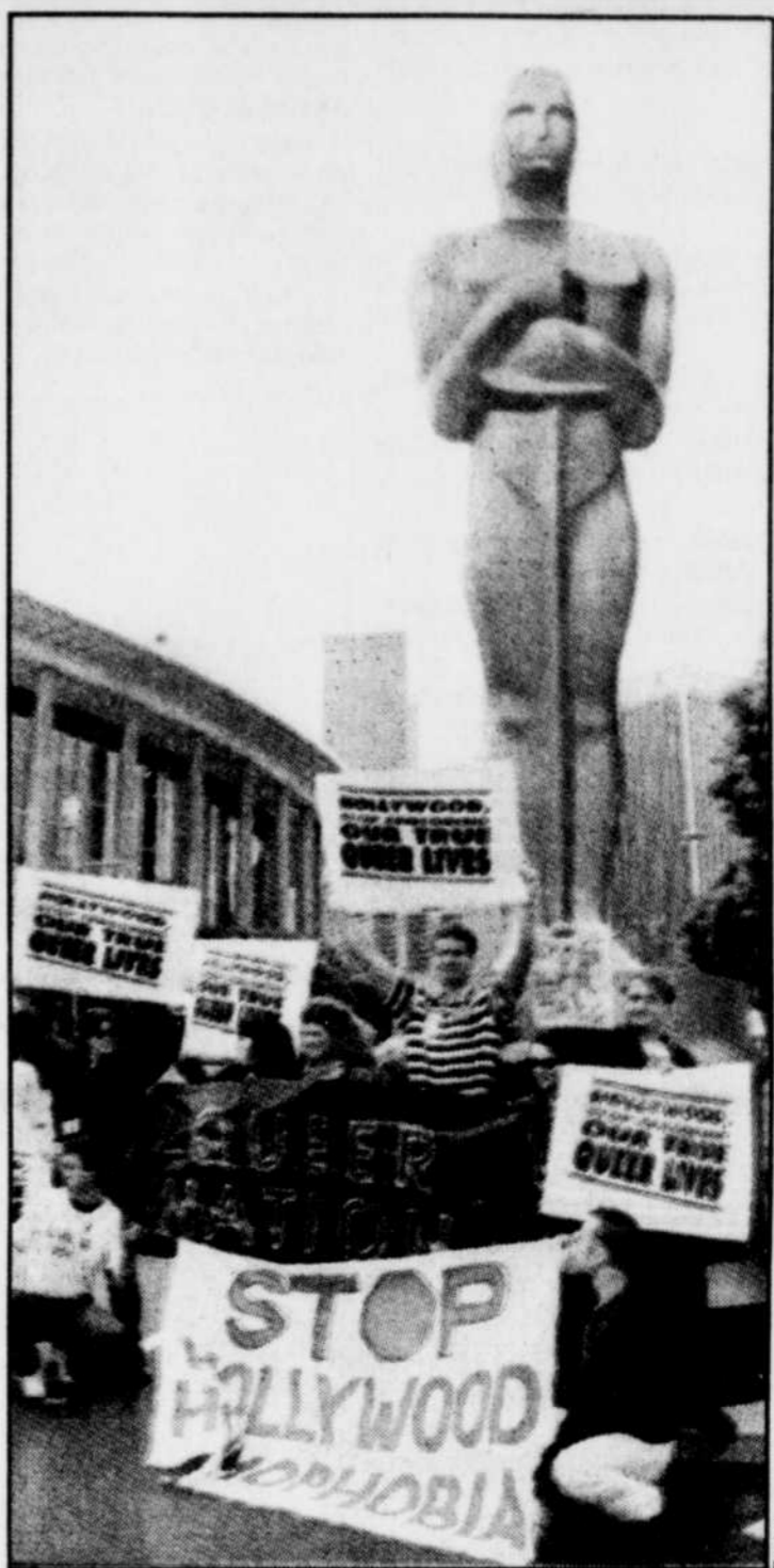
Des homosexuels des deux sexes s'étaient rassemblés devant la statue géante représentant les Oscars pour protester contre le traitement négatif réservé à l'homosexualité au cinéma américain.