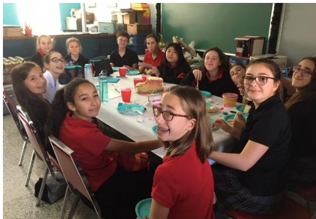
Club de filles

Cette année, Le CDF ( club de filles ) a été de retour et les filles ont amorcé la rédaction d'un livre de recettes. Elles ont cuisiné leurs recettes préférées, ainsi que des recettes familiales. Le livre se poursuivra au cours de la prochaine année.