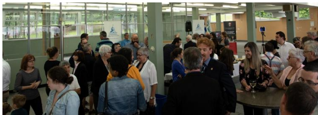
5 à 7 – Lancement de la campagne de financement

Un 5 à 7 a été organisé par la Fondation Collège Saint-Alexandre pour procéder au lancement de la campagne de financement pour la rénovation de la bibliothèque Pierre-Sanscartier. Un début de soirée en compagnie de plus de 80 personnes.