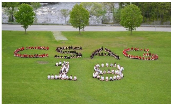
CSAG 18 lors de la Journée Saint-Alexandre

Peu après, ce fut la Journée Saint-Alexandre où, par un soleil magnifique, les élèves ont pu fraterniser entre eux et découvrir l'école et son histoire lors du classique rallye. Cependant, en raison de la canicule qui perdurait, l'horaire a été inversé: les activités sportives en avant-midi et le rallye après le dîner pizza, une nouveauté cette année. De plus, avec la construction sur les terrains avant du Collège, la classique photo CSAG 2018 a été prise au printemps. Le lendemain soir, ce fut au tour des parents de rencontrer l'équipe des enseignants et de prendre connaissance des diverses politiques du Collège et des particularités de la 1 re secondaire lors de la rencontre d'information.