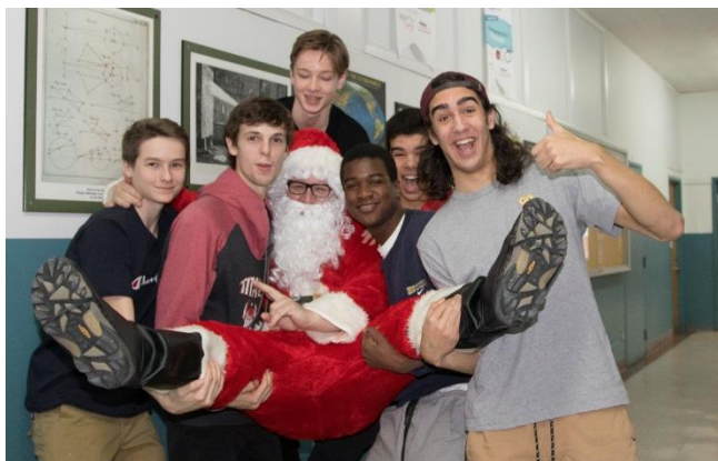
Activités de Noël

Celle-ci a été marquée par plusieurs activités où tous, élèves comme enseignants, ont pu socialiser dans un cadre différent de celui de la salle de classe. En début d'année, il y a eu la Journée Saint-Alexandre dans le parc de la Gatineau . Les participants ont pu se côtoyer lors d'une randonnée pédestre, d'une ronde de golf ou d'une randonnée en canot sur le lac Meech, le tout suivi d'un pique-nique. À l'Halloween, les membres du conseil étudiant ont animé l'heure du dîner en préparant au Studio un concours de costumes et en proposant aux participants des défis de tout genre. En décembre, dans le cadre du cours de français, il y a eu la sortie à la Maison de la culture de Gatineau afin d'assister à la pièce Cyrano de Bergerac . Toujours en décembre, lors de la demi-journée d'activités de Noël, le plaisir était au rendez-vous alors que tous ont dû se surpasser afin de surmonter les défis proposés par les enseignants et ainsi tenter de remporter le trophée emblématique du rallye annuel. En février, une quarantaine d'élèves ont profité des joies de l'hiver en participant à la soirée chocolat chaud à la Patinoire du centenaire. Enfin, la sortie de fin d'année aura permis aux élèves participants de découvrir Montréal à travers les diverses visites thématiques proposées.