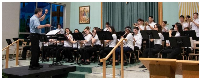
Concert des Harmonies