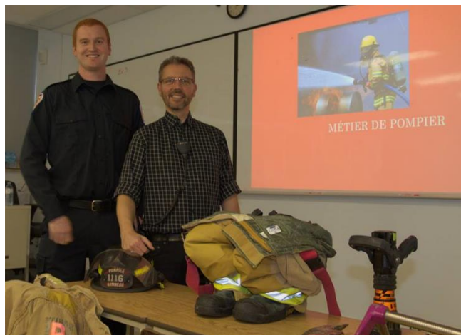
Salon des carrières

Durant la journée pédagogique du mois d'octobre, environ cent cinquante élèves de la 3 e à la 5 e secondaire se sont rendus au Collège pour participer au Salon des carrières . Les élèves présents pouvaient alors assister à jusqu'à trois conférences de l'un des 22 travailleurs-conférenciers.