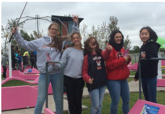
Journée Saint-Alexandre – Complexe Amigo

C'est le mardi 28 août 2018 que l'équipe d'enseignants et d'intervenants de la 3 e secondaire a accueilli les 205 élèves du degré. Pour eux, il s'agissait d'une étape importante de leur parcours scolaire : ils faisaient leur entrée officielle au deuxième cycle du secondaire. Lors de cette demi-journée d'accueil, une attention particulière a été portée aux cinq nouveaux élèves qui nous arrivaient de l'extérieur. Ainsi, après avoir récupéré horaire et effets scolaires, l'année était officiellement lancée. Celle-ci aura été parsemée de plusieurs activités qui auront permis de l'agrémenter.