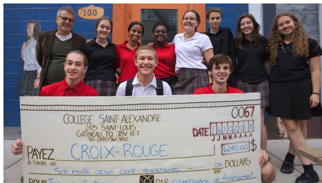
Campagne de financement des élèves

La générosité des élèves du Collège et de leurs parents témoigne d'un souci constant d'aider la communauté d'ici et d'ailleurs tout au long de l'année. C'est plus de 15 255 $ que nous récoltons pour les sinistrés de la tornade du secteur Mont-Bleu. Nous avons également amassé, lors d'une campagne ponctuelle, 1 300 $ pour le Fonds SOS Inondations Centraide Outaouais. Le volet international n'est pas en reste, car nous avons envoyé un chèque de 1 100 $ à Oxfam-Québec lors de la Marche Monde en mai dernier. C'est donc un montant total de 17 655 $ ramassé sous la supervision des élèves de la campagne de financement. Un des plus gros montants amassés dans la courte histoire des campagnes au Collège.