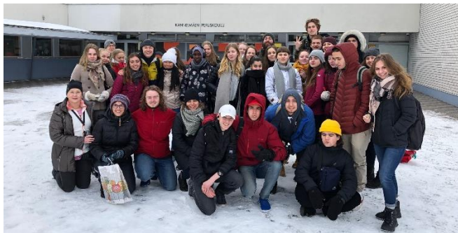
Voyage de l'animation sociale