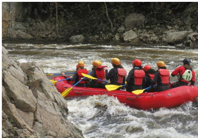
Sortie de fin d'année – Propulsion Rafting

En avril, deux activités de sensibilisation ont été offertes aux élèves. La première présentait les impacts d'un dossier juvénile sur la vie des jeunes et la seconde portait sur la cybersécurité. Au début mai, treize élèves ont participé au programme des mini-cours d'enrichissement offerts par les universités d'Ottawa et Carleton de même que le collège La Cité . Tous les élèves ont aussi été invités à assister à la danse du printemps , un retour pour cette activité après vingt-cinq ans de pause. Toujours en mai, les élèves du degré ont reçu une formation en réanimation cardio-respiratoire (RCR), obtenant ainsi une certification Héros en 30 . Enfin, la sortie de fin d'année tenue au début juin sur le site de Propulsion Rafting sur la rivière Rouge aura permis à tous de se divertir et de relaxer avant la session d'évaluation de fin d'année. Une belle façon de terminer l'année scolaire.