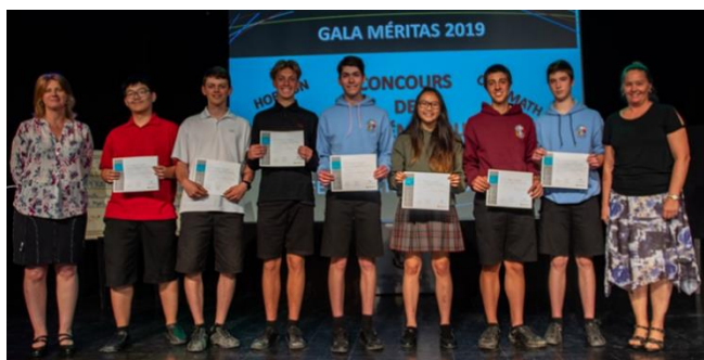
Gala Méritas – Prix des concours de mathématique

Finalement, le Gala Méritas du 11 juin et le bal des finissants du 22 juin au Palais des Congrès de Gatineau sont venus compléter la liste des activités.