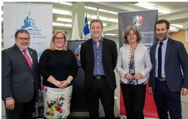
Campagne de financement de la bibliothèque