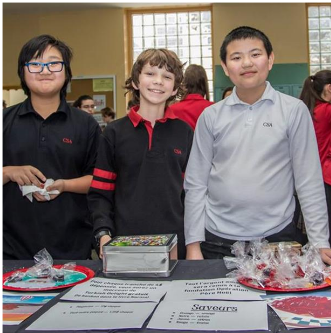
Foire de Noël

En janvier, un groupe d'élève a commencé à manier l'art de la confection de cartes, afin de mettre sur pieds le groupe des Fées du CSA . Ce groupe a confectionné des cartes pour la fête des Mères et la fête des Pères. Celles-ci ont été vendues afin de ramasser des fonds pour la campagne de financement des élèves. Quelques centaines de dollars ont été amassés par l'entremise de ce projet.