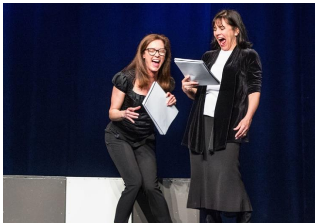
Spectacle-lecture Les rendez-vous au cœur du théâtre