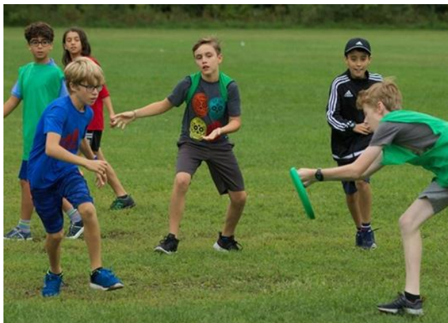
Journée Saint-Alexandre – Activités au Collège

C'est en plein cœur d'un superbe été beau et très chaud, le lundi 27 août, que nous avons accueilli les élèves de la 1 re secondaire, suivi de la traditionnelle Champfête . Tout est en place et l'équipe d'enseignants du degré ainsi que tous les éducateurs débordaient d'enthousiasme à l'aube de cette nouvelle année scolaire, prêts à assurer un encadrement et un suivi efficace auprès des élèves tout au long de l'année.