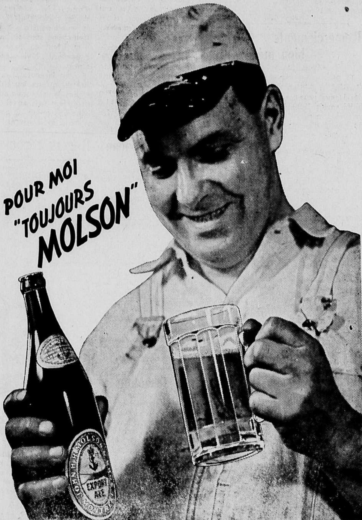
LA BIÈRE QUE VOTRE ARRIÈRE GRAND-PÈRE BUVAIT

chez NOM DE L'EMBOUEILLEUR LEMAY ENREGISTRE, -- Landrienne