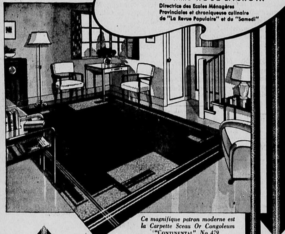
Ce magnifique patron moderne est la Carpette Sceau Or Congoleum "CONTINENTAL", No 479.