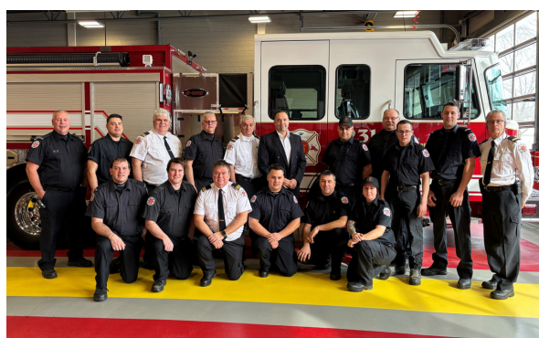
Une partie de l'équipe du Service de sécurité incendie posant devant le nouveau véhicule autopompe.

Le Service de sécurité incendie a réalisé un total de 270 sorties en 2023 tandis qu'il y en avait eu 235 en 2022. L'équipe a répondu à 18 appels d'entraide, en plus d'intervenir pour cinq feux de véhicules. Du côté des premiers répondants, il y a eu 88 sorties.