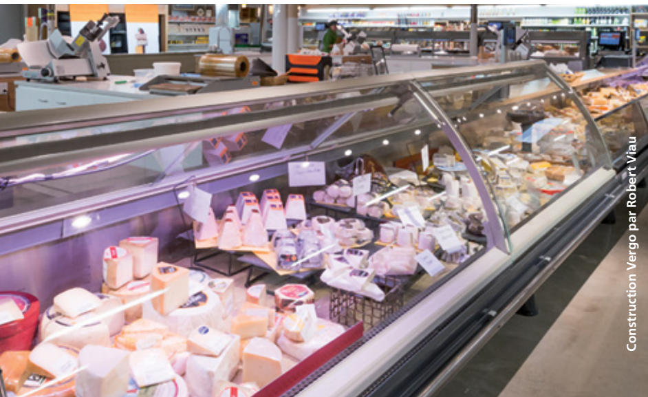
Construction Vergo par Robert Viau

Une heure avant l'ouverture, les « acteurs » entrent en scène : rotation des produits, préparation des paniers, c'est le home staging des étals! Tout doit être attrayant et facilement accessible. Les qualités requises? Proposer des mélanges créatifs de couleurs, de formes et de textures, adorer le public et le conseiller.