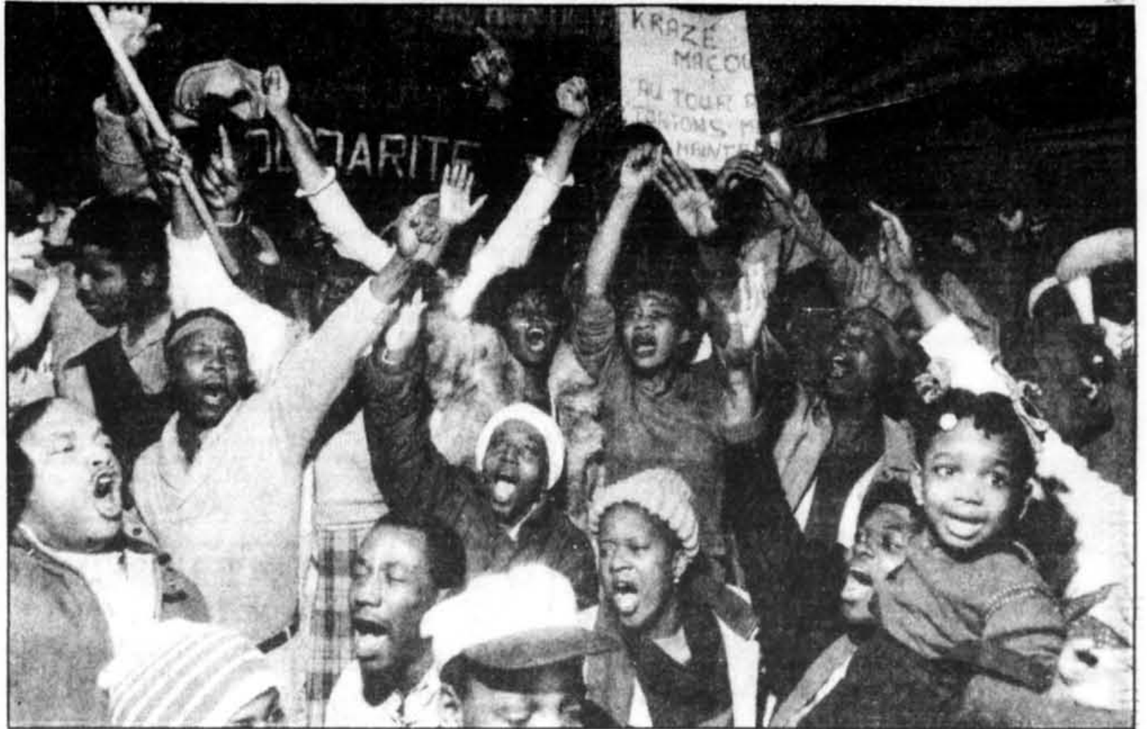
Une foule en liesse fêtait, hier dans les rues de Montréal, la délivrance d'Haïti.

Chacun pouvait avoir ses confidences, mais l'heure était à la danse et aux chants scandés en créole. Chants, danses et réjouissances se sont poursuivies à la Maison d'Haïti où une autre fête