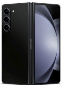
Samsung Galaxy Z Fold5

Choisissez parmi une incroyable sélection de téléphones intelligents. Vous les adorerez sur le meilleur réseau 5G au pays*.