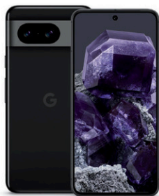
Google Pixel 8