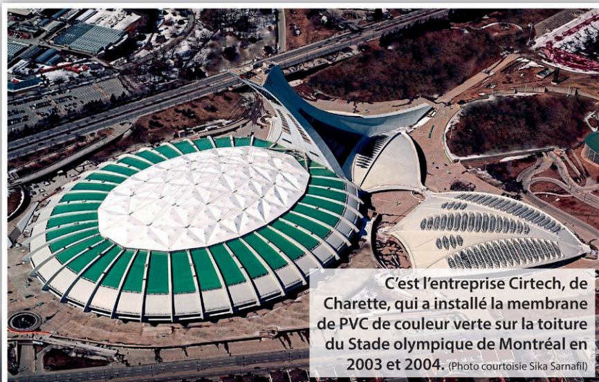
C'est l'entreprise Cirtech, de Charette, qui a installé la membrane de PVC de couleur verte sur la toiture du Stade olympique de Montréal en 2003 et 2004.