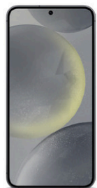
Samsung Galaxy S24