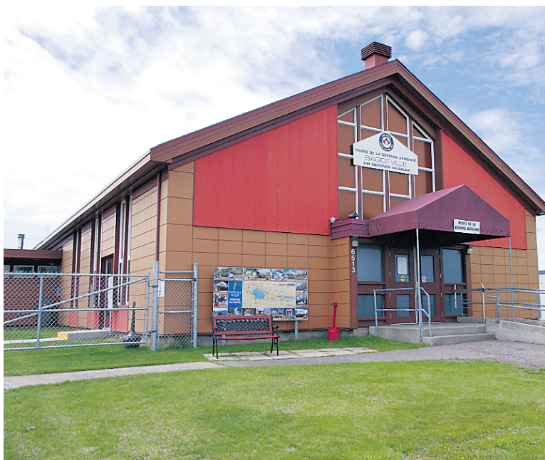
Le musée de la Défense aérienne de Bagotville est situé à l'intérieur de l'ancienne église protestante de la base aérienne du Saguenay.