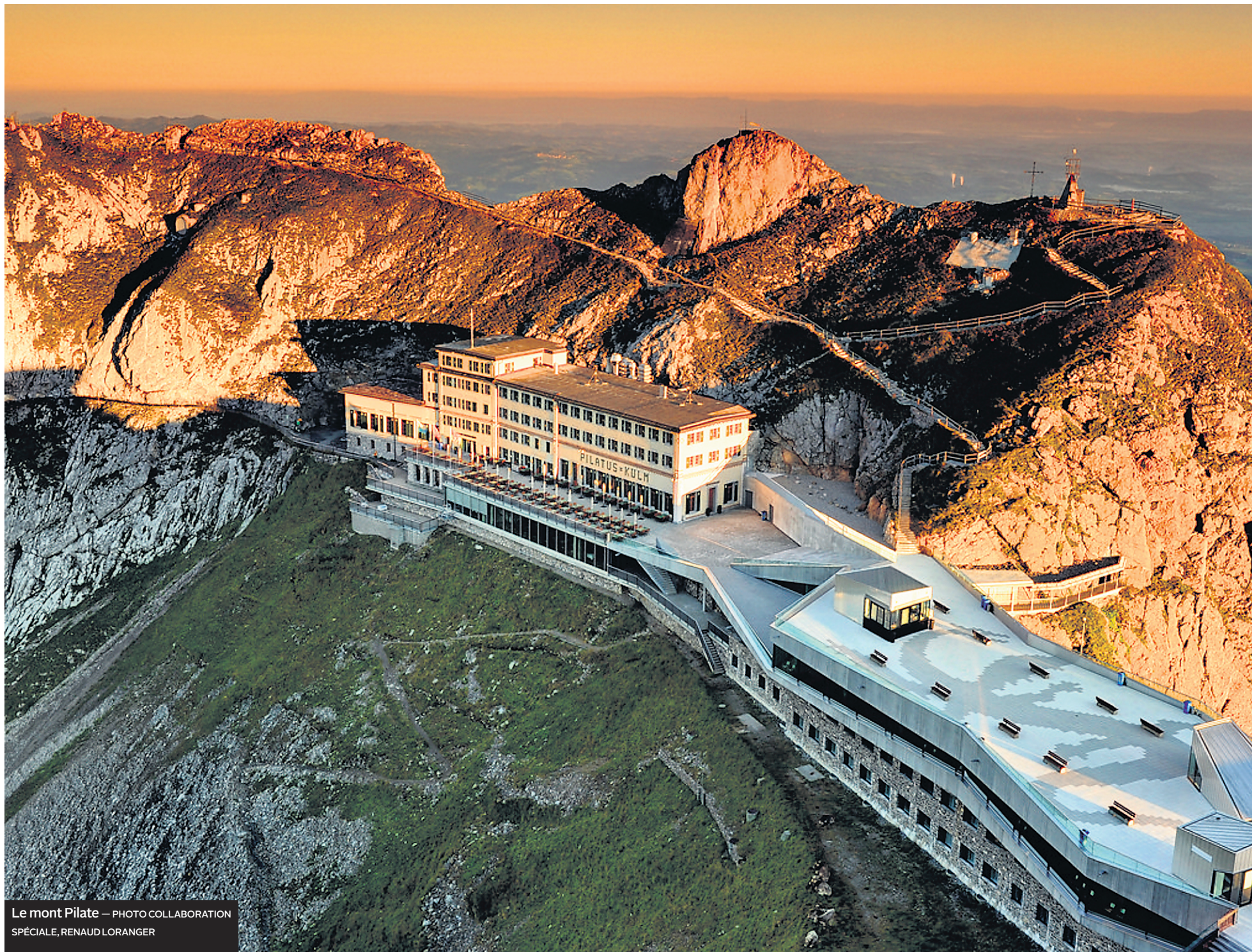
Le mont Pilate