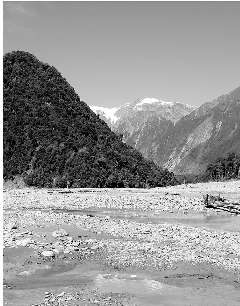
Franz Josef, c'est beaucoup de nature et un glacier qui disparaît à vue d'œil.

Le même genre de cachet m'a enlacé d'une longue étreinte à Wilderness, en Afrique du Sud. Déjà, le nom poétique annonce le