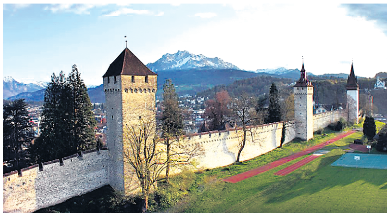
Le mur Musegg