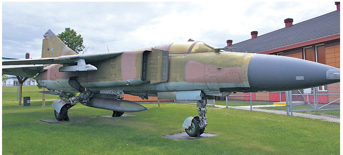
Le Musée est le seul en Amérique du Nord qui a en sa possession un avion de chasse russe de l'ère soviétique MiG-23, don de la Tchécoslovaquie. — PHOTO LE SOLEIL, PAUL-ROBERT RAYMOND

Toutefois, il y a des prérogatives de sécurité pour profiter de cette «largesse», surtout après les événements de l'automne dernier à Saint-Jean-sur-le-Richelieu et à Ottawa. «Aucun appareil photo, téléphone ou même portefeuille ne peut être apporté avec soi durant la visite», ajoute M. Langlois. «Les visiteurs doivent laisser ces objets dans les casiers prévus à cette fin, en échange d'une pièce d'identité.» PAUL-ROBERT RAYMOND