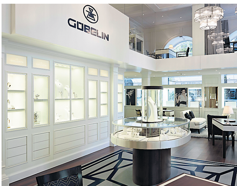
La bijouterie Gubelin