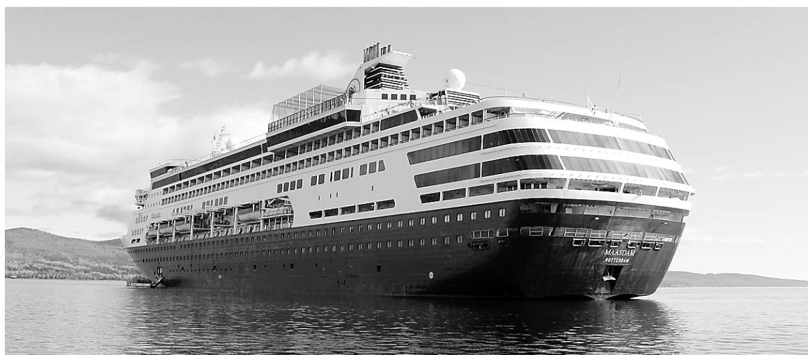
Le Maasdam fera escale à Québec le 9 août, puis les 21 et 23 août. — PHOTOTHÈQUE LE SOLEIL

TripsAdvisor possède désormais ses antennes dans 45 pays à travers le monde et se décline dans 28 langues. LE SOLEIL