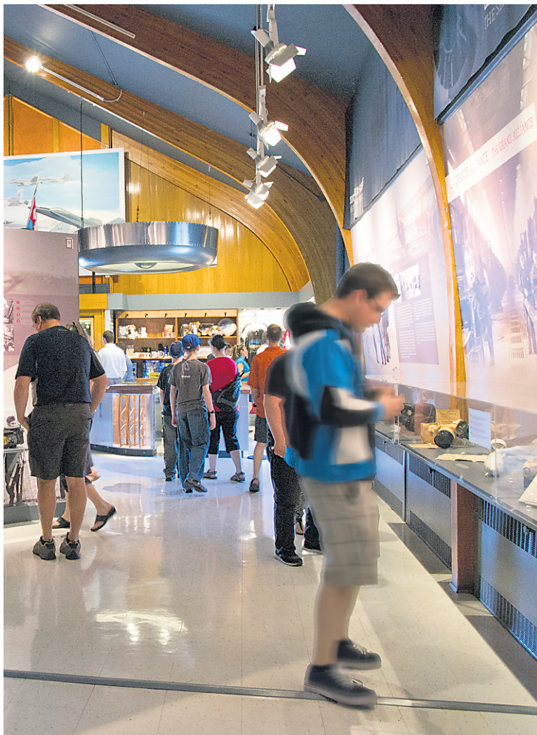
L'exposition permanente Maîtres du ciel et la temporaire sont bonifiées par l'écoute d'un audioguide, sur des tablettes iPad Mini — pouvant être louées sur place.