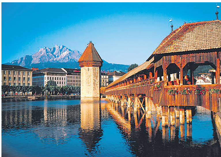
Le pont de la Chapelle