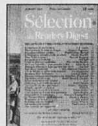
La page couverture du premier numéro québécois, publié en juillet 1947

bécois, ce magazine en format de poche avec ses condensés d'histoires plus ou moins joviales à la gloire du travail, de la famille et de la patrie. Je me souviens de mon côté d'un amoncellement de vieux numéros d'après-guerre découverts dans un grenier et parcourus en rafale avec une sorte de fascination amusée. L'être le plus extraordinaire jamais rencontré y côtoyait la prostate de Georges soudain volubile et l'éloge du self made man . L'URSS était le dragon à abattre et l'humour en uniforme montrait l'armée sous un angle goguenard. On y célébrait les valeurs traditionnelles et familiales, informant tout en délassant dans un style concis, voire minimaliste, à travers des versions condensées. Ni fioritures ni envolées stylistiques. De l'abrégé. Clarté, efficacité, conformisme, éloge de l'effort et de la réussite. Faites une en-