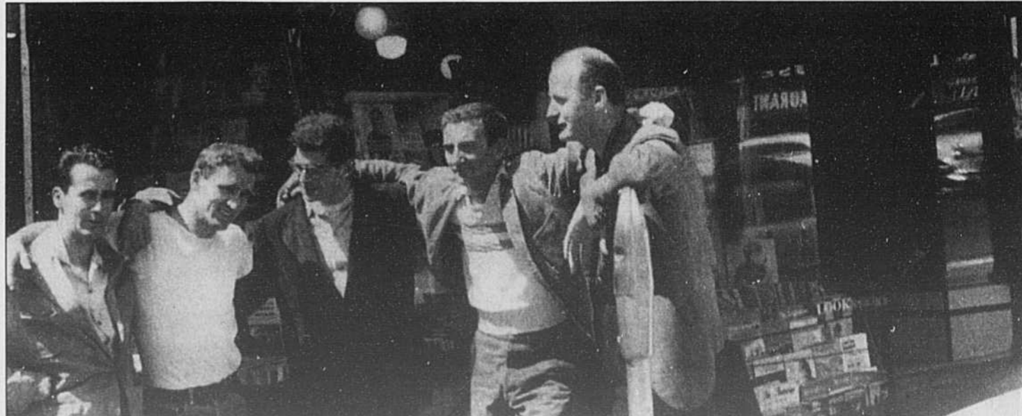
Quelques comparses de la beat, dont Cassidy, Ginsberg et Ferlinguetti. En haut, Untitled (Tornado Dead: 223) , de Burroughs.

Le dernier mot? Puisse-le chez Bowles. « Ma non-existence était la condition sine qua non de la validité de l'univers que j'inventais. »