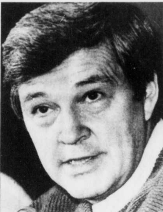
Le député libéral Raymond Garneau

Selon le député de Shefford, l'arrivée de Raymond Garneau à la tête des libéraux fédéraux du Québec va fournir un important point de ralliement aux militants et permettre d'obtenir une unité dans le parti, ainsi qu'une plus grande clarté dans le discours politique. "En l'absence de leader au Québec, souligne-t-il, les messages du parti étaient surtout conflictuels."