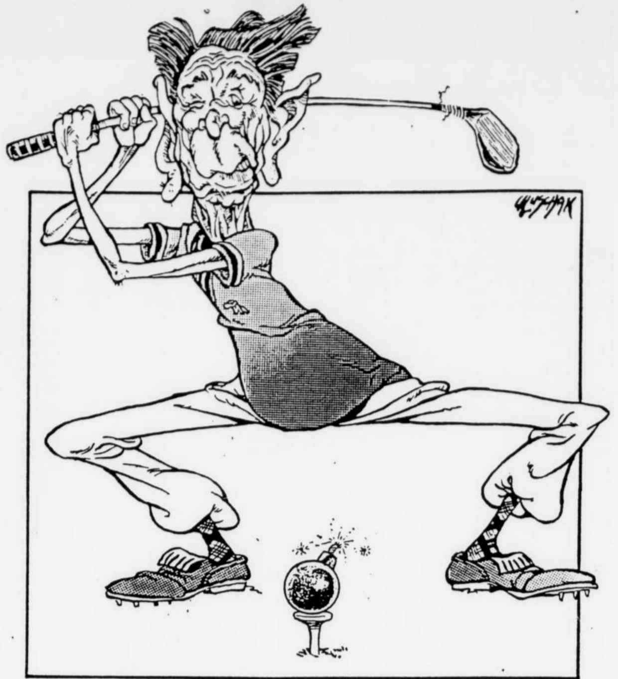
Le golf Persique...