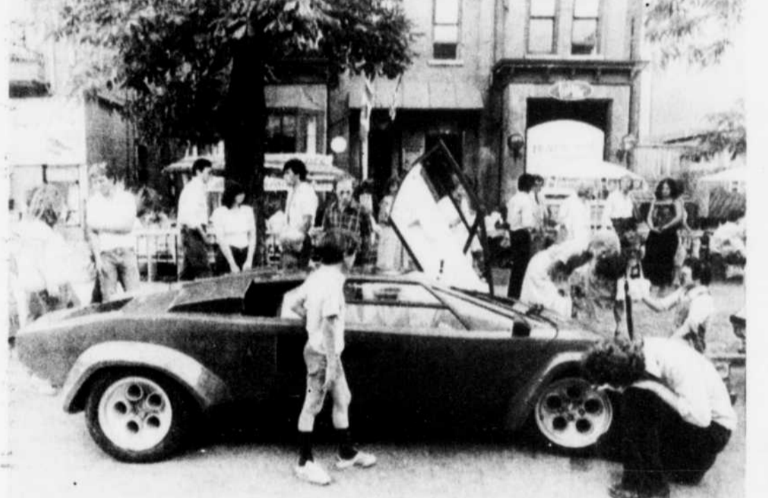
Quand le propriétaire d'une Lamborghini Countach gare son automobile dans une rue achalandée, il peut s'attendre inévitablement à attirer les regards, particulièrement ceux des jeunes qui ne se privent pas d'aller jeter un coup d'oeil.