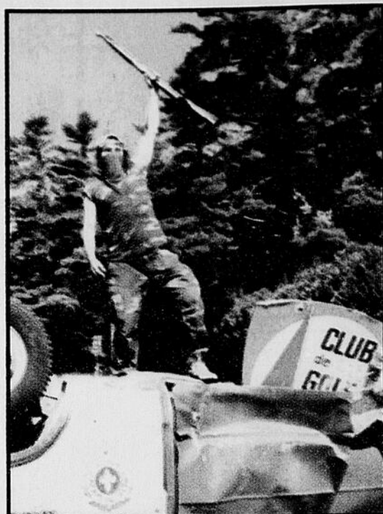
Comme lors de la crise d'Oka, en 1990, le blocus imposé par les Micmacs de Listuguj, en Gaspésie, pourrait facilement dégénérer. Même si huit années ont passé et que les lieux sont différents, la rhétorique des traditionalistes est la même.

Les dissidents ont manifesté leur mécontentement, hier soir, après avoir sillonné les rues de