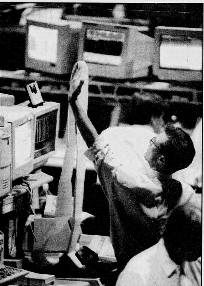
Les spéculateurs qui misaient sur une baisse sans fin du dollar canadien ont été pris de court vendredi, soudain obligés de payer plus cher le huard pour encaisser le coup.