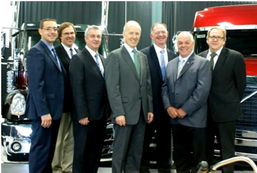
Conférence de presse CamTest Québec