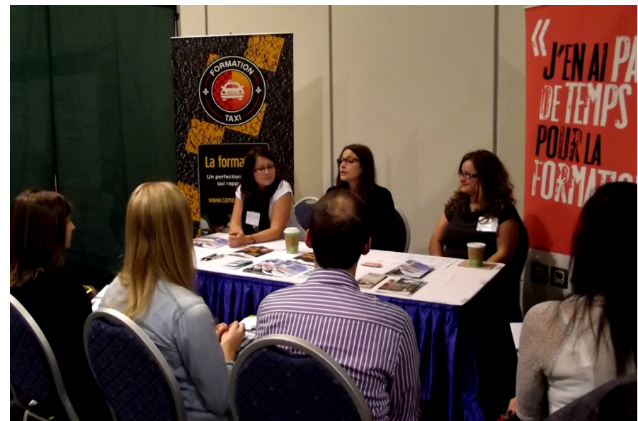
Tournée régionale des CSMO en Outaouais