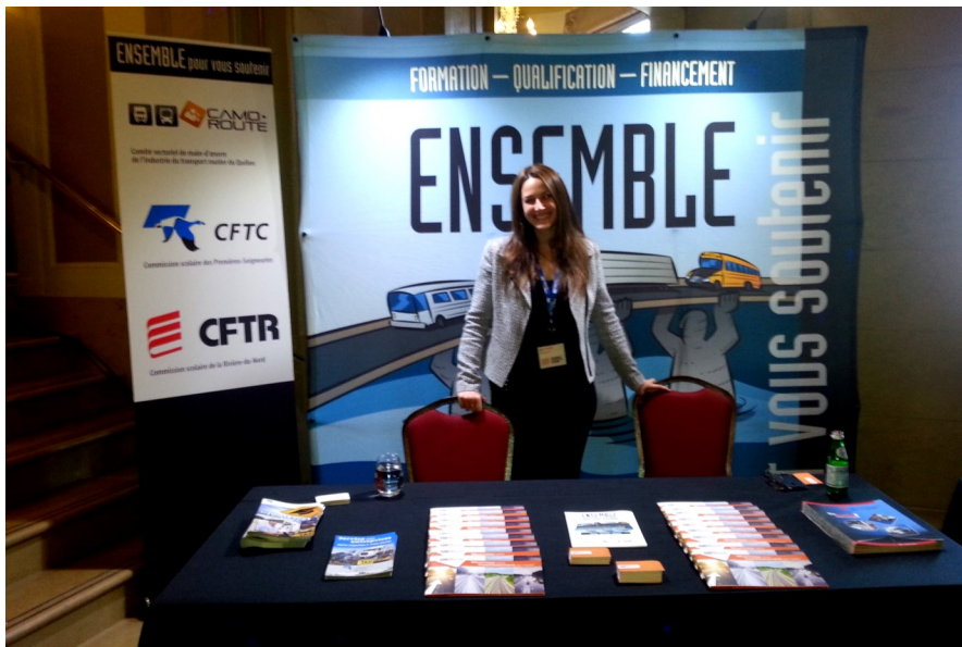
Congrès annuel de l'APMLQ