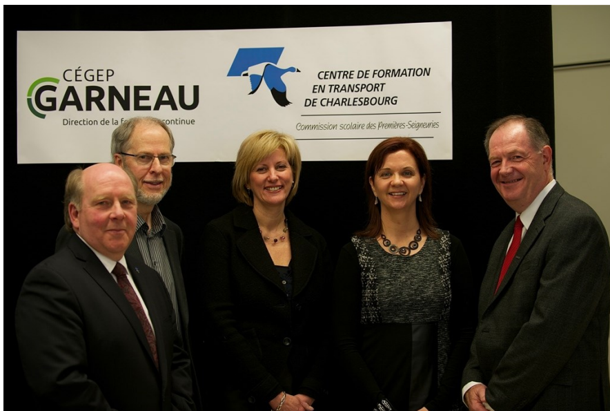
Formation inédite dans le transport routier