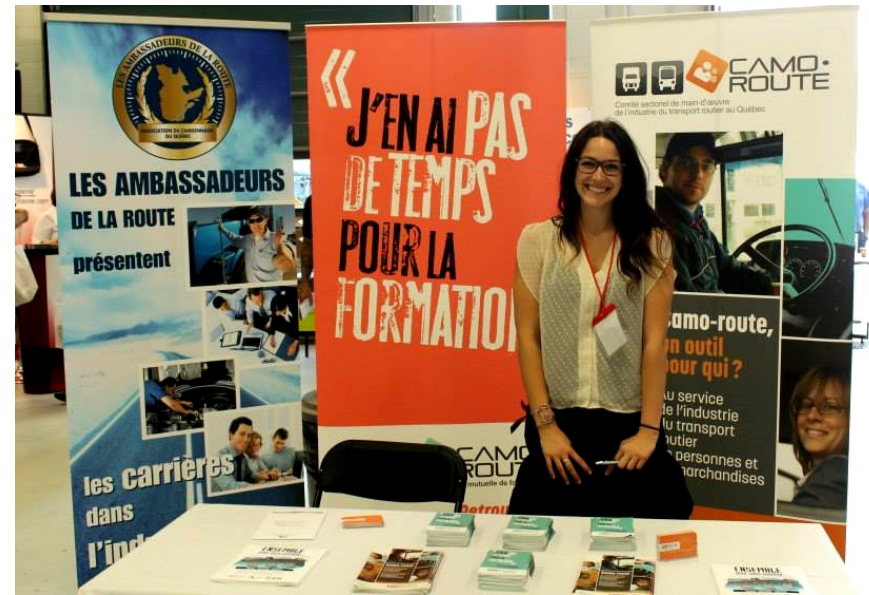
Salon CamTest Québec