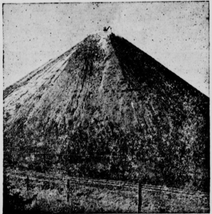
Cette "pyramide" à Thetford Mines pèse environ 30,000,000 de tonnes. Elle est formée de refus de broyage d'amiante provenant de quatre mines qui se sont accumulés

Au nombre des questions à l'étude, mentionnons l'organi-