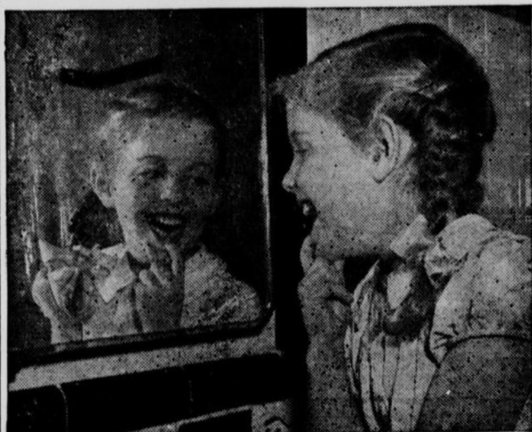
Les photos réfléchies dans un miroir sont faciles à prendre, agréables à posséder et amusantes lorsqu'il s'agit d'impressionner vos amis.