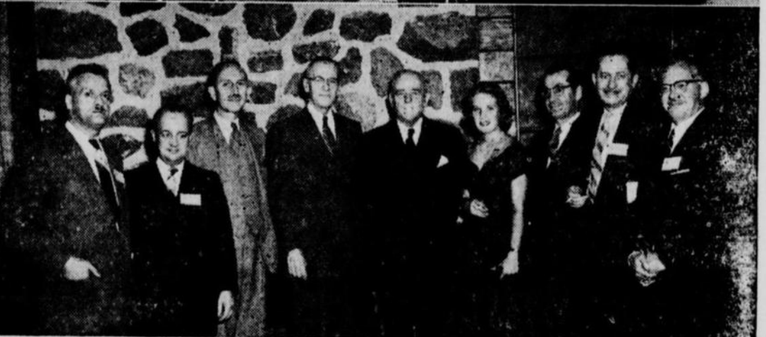
L'Association des Hebdomadaires de Langue française du Canada a tenu son congrès annuel à Ste-Adèle, à l'Hôtel Chanteclerc, les 14, 15 et 16 octobre dernier. Ces photos ci-dessus furent prises lors du banquet de clôture de samedi soir.