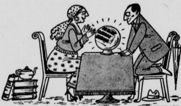
"Oh! mais, M. Lavigne... vous n'avez pas à vous inquiéter de l'avenir"