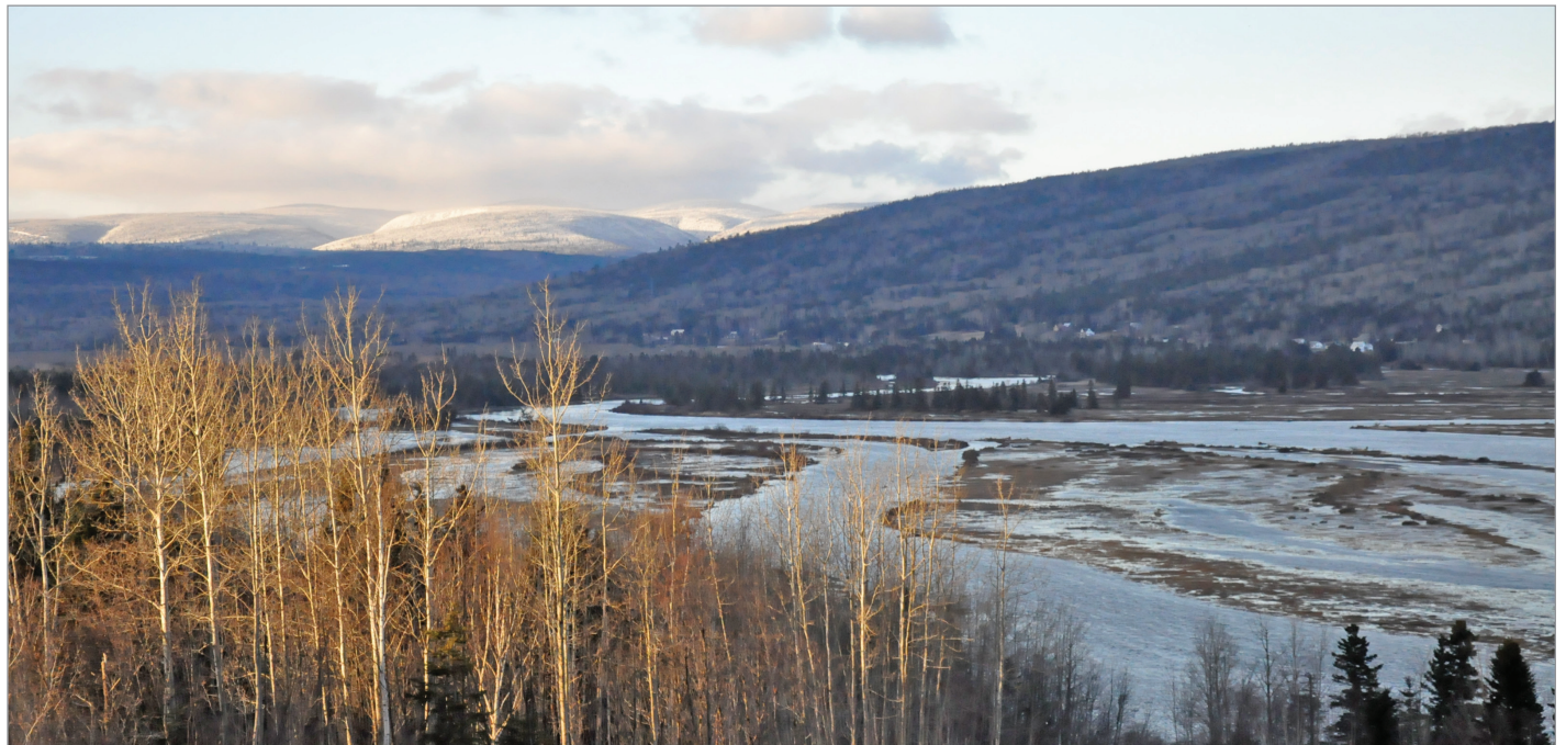
La rivière York, à risque de contamination selon la Fondation Rivières.

Cette annonce est en lien avec les forages de la compagnie Pétrolia, qui s'effectueront à proximité de deux rivières à Saumon, soit la rivière York et la rivière Saint-Jean. Selon la Fondation Rivières, les risques de contamination du ruisseau Dean (qui se jette dans la rivière York) sont bien réels, et auraient un impact sur la vitalité des saumons.