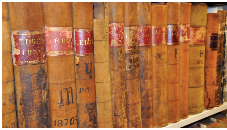
Une partie des livres des archives du Musée de la Gaspésie