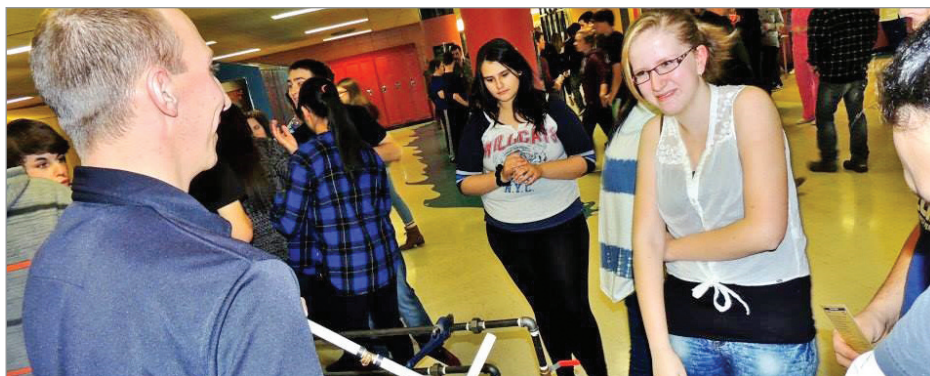
Cette tournée des établissements secondaires a permis aux jeunes de se familiariser avec plus de 60 métiers.

Les participants semblent, pour la plupart, avoir apprécié leur incursion dans le