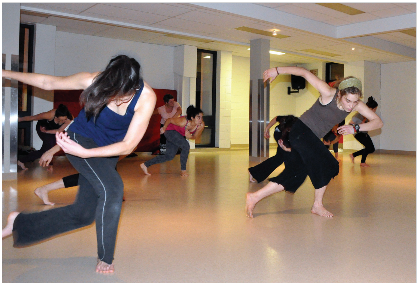
Les danseuses en pleine démonstration

Les inscriptions auront lieu au mois de janvier pour la session d'hiver.