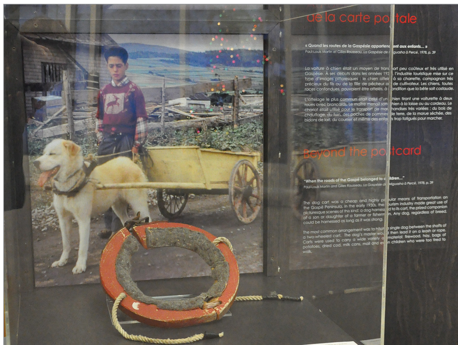
Dans cette exposition on retrouve un collier pour chien.

Le Musée de la Gaspésie a dévoilé cette fin de semaine ses vitrines pour l'exposition Tout un Héritage !, créées en collaboration avec la population de la Gaspésie. Chaque vitrine sera envoyée, avec les objets patrimoniaux qu'elle contient, dans les bibliothèques de la Gaspésie au cours du mois de janvier 2015.