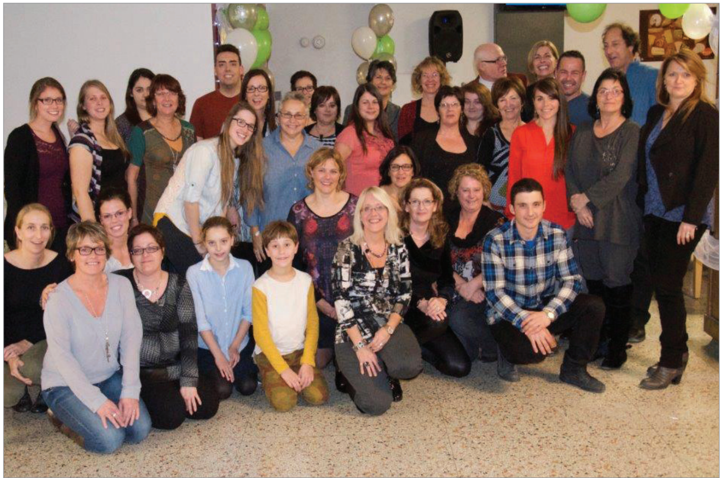
Membre de l'équipe, bénévoles et membre du conseil d'administration qui œuvrent ou qui ont déjà œuvré à L'Aid'Elle dans les dernières 25 années.

Tous les profits amassés lors de la soirée permettront de réaliser les rénovations de la salle de jeux dédiée aux enfants hébergés. Cette soirée était aussi l'occasion de souligner le 25e anniversaire de l'organisme. Les personnes présentes ont donc pu prendre acte du travail accompli et de tout ce qui reste à faire.