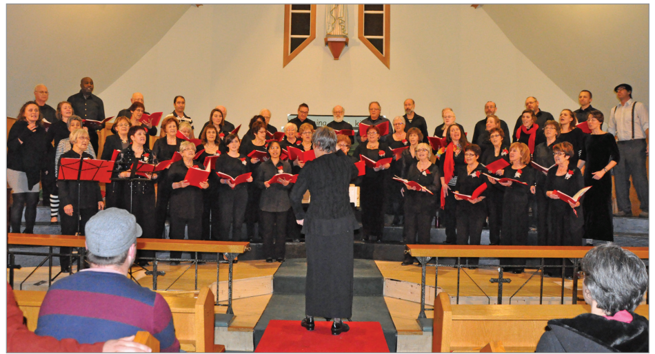
Un numéro a réuni la chorales Les Voix du Large et l'ensemble vocal Les Voyous

Un numéro particulièrement réussi a réuni en milieu de spectacle les chanteurs des deux groupes afin de présenter « La ballade en traîneau » (photo). Le spectacle est présenté la fin de semaine prochaine à Grande-Vallée.