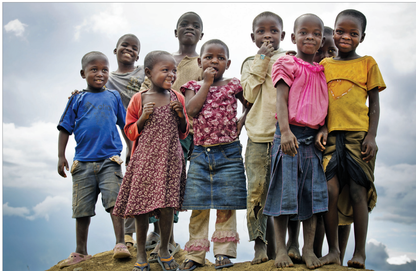
Des enfants de partout au monde bénéficieront des Cadeaux de Survie de l'UNICEF.