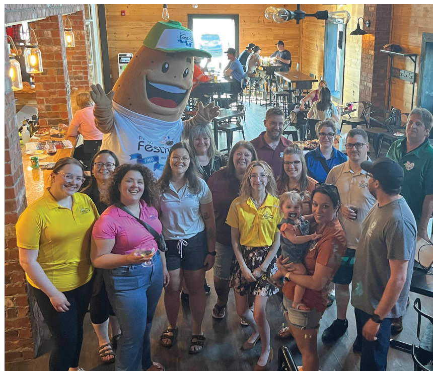
Du 29 juin au 2 juillet, il régnera une ambiance de fête du côté de la Municipalité régionale de Grand-Sault, puisque le 61e Festival régional de la patate battra son plein.

«Par exemple, lors du Défi des écoles McCain / McCain High School Challenge, qui consiste en une compétition entre les écoles secondaires de la région, il proposera des activités liées à la pomme de terre. Ça risque d'être plaisant et les parti-