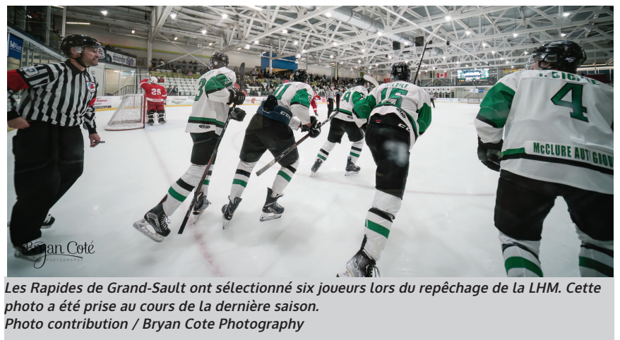
Les Rapides de Grand-Sault ont sélectionné six joueurs lors du repêchage de la LHM. Cette photo a été prise au cours de la dernière saison.

Avec le 52e choix au total, soit lors du cinquième tour, les Rapides ont choisi le défenseur de 16 ans, Jack Marnell. Originaire de Saint John's (Terre-Neuve-et-Labrador), Mar-