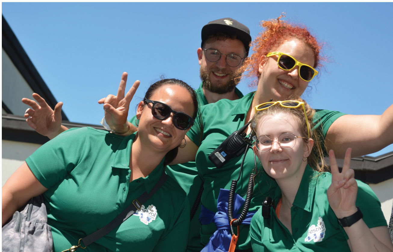
Le traditionnel défilé aura lieu le 2 juillet, dès 13h, sur le boulevard Broadway. Cette photo a été prise lors du défilé 2022.

En plus d'inviter les gens à prendre connaissance de la programmation complète du Festival ( https://fr.gfpotatofestival.ca/ ), la présidente confirme le