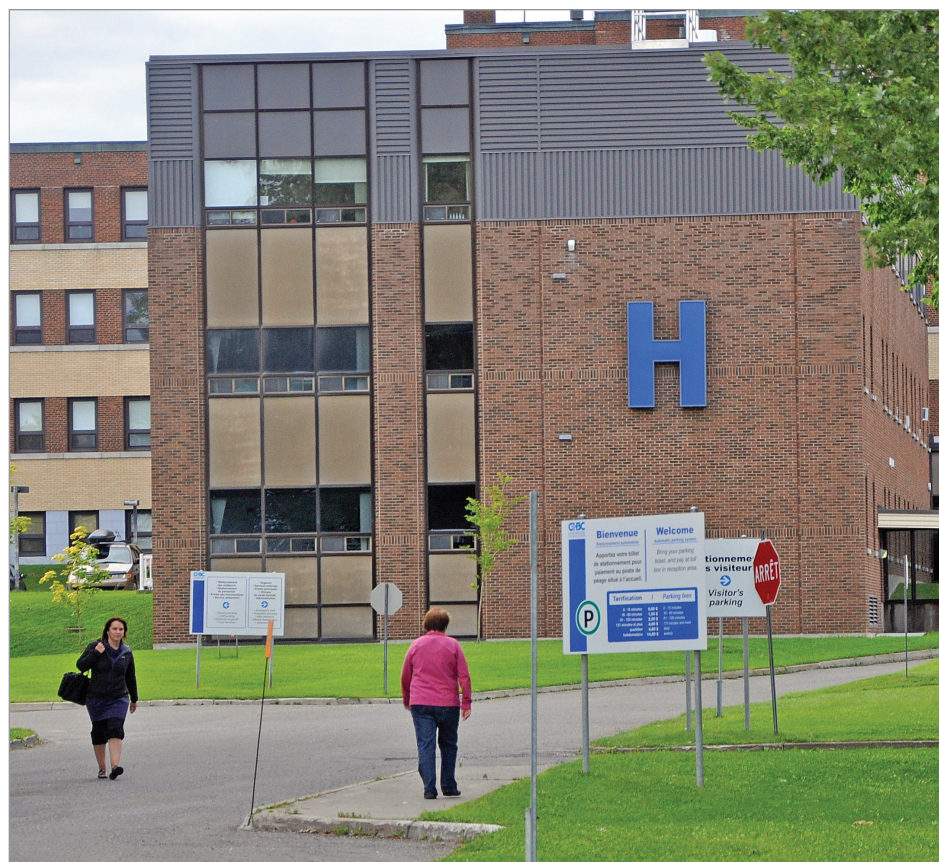
Un sondage réalisé auprès de 913 usagers du CSSSBC a donné des résultats supérieurs à la moyenne québécoise pour des établissements comparables.

Pour les centres d'hébergement de New Carlisle, de Maria et de Matapédia, les résultats se démarquent de façon statistiquement significative, puisqu'ils dépassent le niveau supérieur du groupe comparable de CHSLD avec des écarts d'environ 5 points de pourcentage :