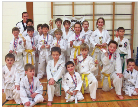
Environ 25 élèves de 4 à 12 ans de l'école de taekwondo Rock Mercier ont participé à une expérience de compétition le 29 novembre.

Samedi le 29 novembre, l'école de taekwondo Rock Mercier a organisé au New Richmond High School une compétition amicale; un événement intitulé Mes premiers jeux, qui permettait à environ 25 élèves de 4 à 12 ans de participer à une expérience de compétition.