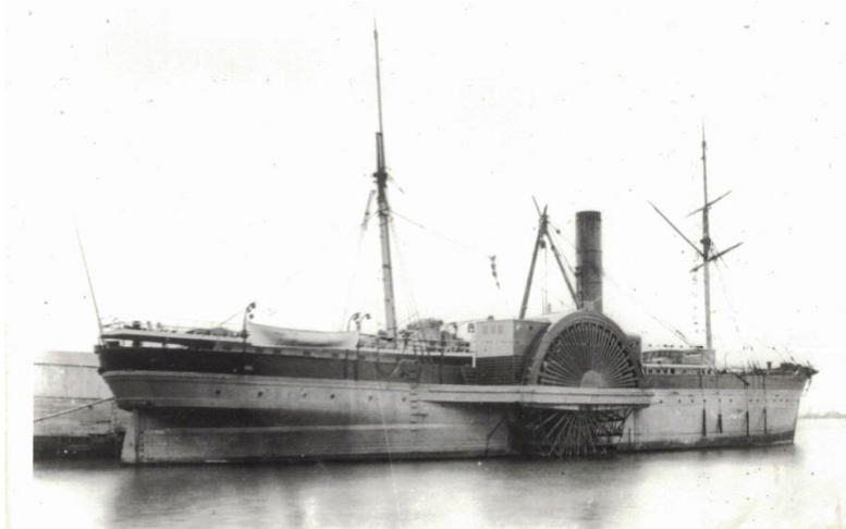
Empire City, 1852

j'arrivai à La Nouvelle-Orléans et j'eus la chance de trouver une goélette mexicaine qui partait le même jour pour Veracruz où je suis arrivé hier sans accident. Mon passage sur l' Empire City ne m'a rien coûté. Celui de La Nouvelle-Orléans ici m'a coûté 35 piastres.