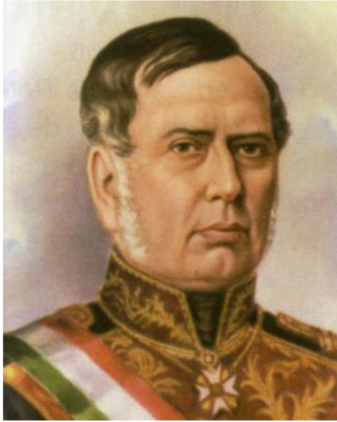
Mariano Arista, président du Mexique