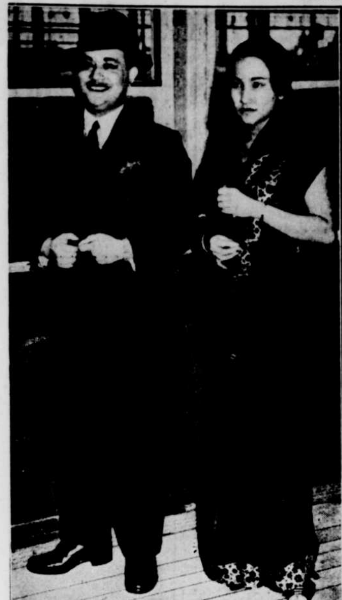
L'exposition universelle de New-York continue à attirer des visiteurs de tous les coins du globe.