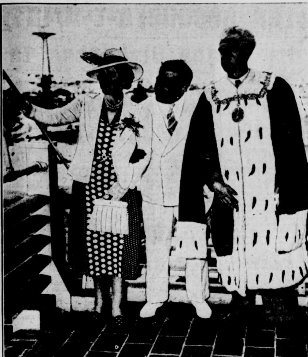
Le maharajah de Tripura, gouverneur du seul état de l'Inde, qui ne paie pas le tribut à la Grande-Bretagne, est récemment débarqué du Queen Mary, à New-York.