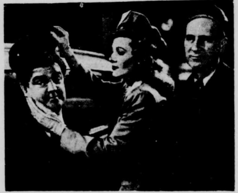
L'amour frappe Costello dans le film "In Society", mais Abbott n'y approuve pas.