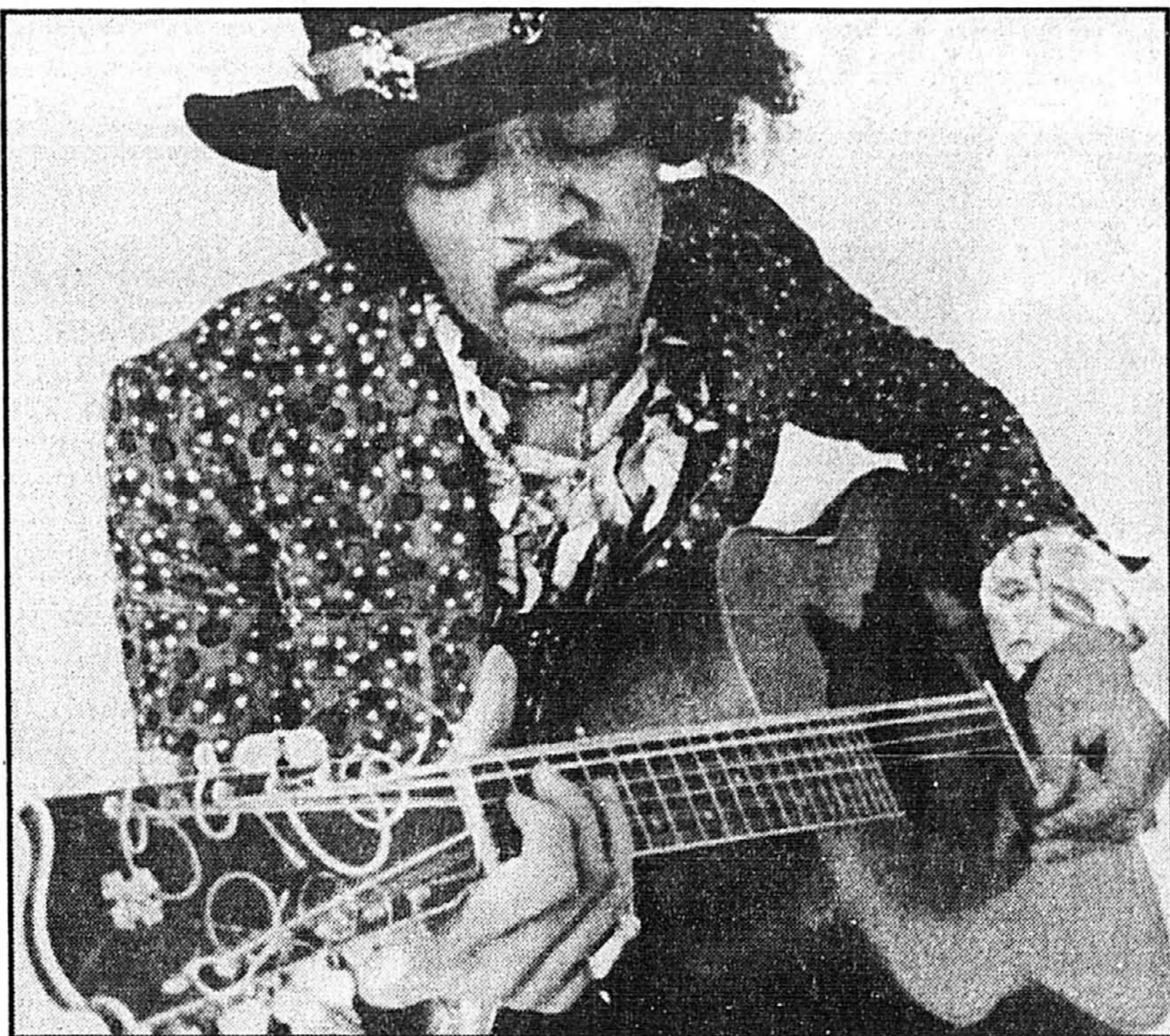
Depuis 1970, une vingtaine d'albums posthumes ont été consacrés à Jimi Hendrix, s'ajoutant aux cinq sortis durant sa carrière météorique.

Il y a aussi le phénomène croissant de ces