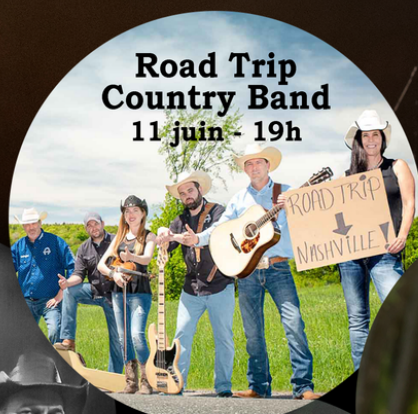
Road Trip Country Band 11 juin - 19h