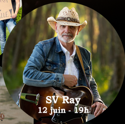
SV Ray 12 juin - 19h