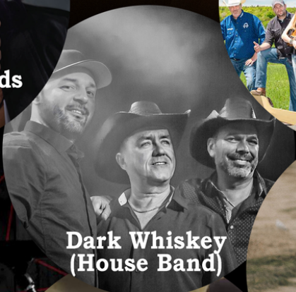
Dark Whiskey (House Band)