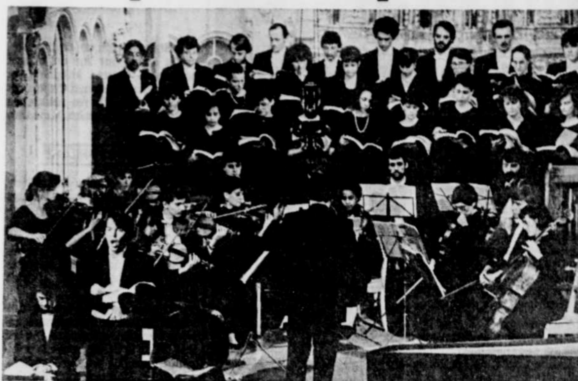
Les Violons du Roy et l'Ensemble vocal Bernard Labadie interprètent «Le Messie», hier, à la chapelle du Bon-Pasteur

Tel quel, Le Messie se voit décapé d'une bonne couche de la grandiloquence qui l'enveloppe souvent et retrouve la fraîcheur et la franchise de ses sorogines. Les airs de la basse Why do the Nations and The trumpet shall sound