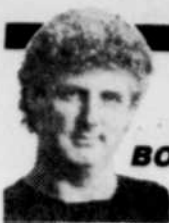
par Alain BOUCHARD

« Personne n'osait prononcer le mot, raconte Monique. J'ai dit: c'est le cancer? On m'a répondu: oui. Je suis devenue raide comme un barre. Puis c'est dehors, en sortant de l'hôpital, que j'ai craqué. Dans les bras de mon père ».