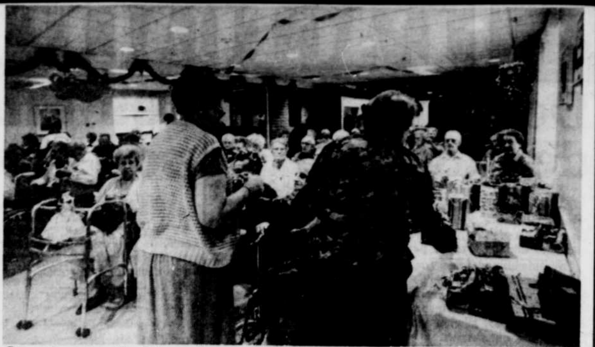
On chante Noël au foyer de Loretteville

initiative, la CTCUQ veut faciliter et rendre plus sécuritaires les nombreux déplacements qui s'effectuent lors de ces deux grandes soirées du temps des Fêtes. L'organisme de transport en commun avait fait de même, il y a deux ans. ●