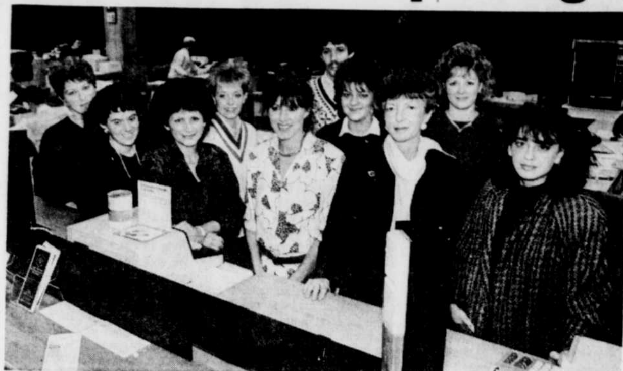
Une dizaine d'employés de la caisse populaire des fonctionnaires constituent le noyau qui organise des activités pour les personnes démunies au temps des fêtes. En tout, c'est une quarantaine d'employés qui participent d'une façon ou d'une autre à ces événements.

Une vingtaine d'employés de la caisse iront servir le repas. Ils distribueront aussi environ 200 bas de