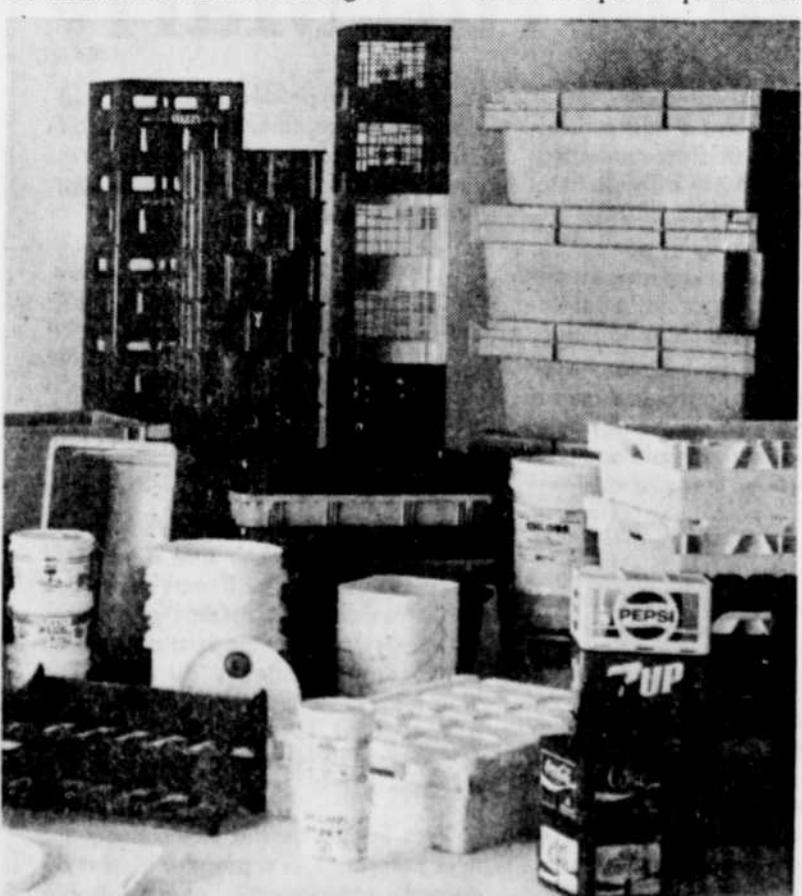
C'est dans le secteur de la fabrication de contenants industriels et d'entreposage qu'IPL a le mieux réussi à s'imposer.

C'est précisément en raison de l'importance que l'on apporte à la qualité et à la productivité qu'IPL souhaite la création prochaine du Centre de recherches sur les plastiques, à Saint-Damien. L'entreprise a d'ailleurs subventionné le groupe qui en fait la promotion, depuis quelque temps.