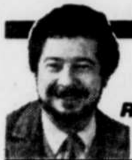
par Raymond GIROUX

♦ Il faut percevoir comme un tocsin le discret coup de grelot lancé ces dernières semaines par le Conseil supérieur de l'éducation sur la perversité du système actuel d'enseignement des sciences sociales et humaines et ses effets néfastes sur l'avenir des jeunes Québécois.