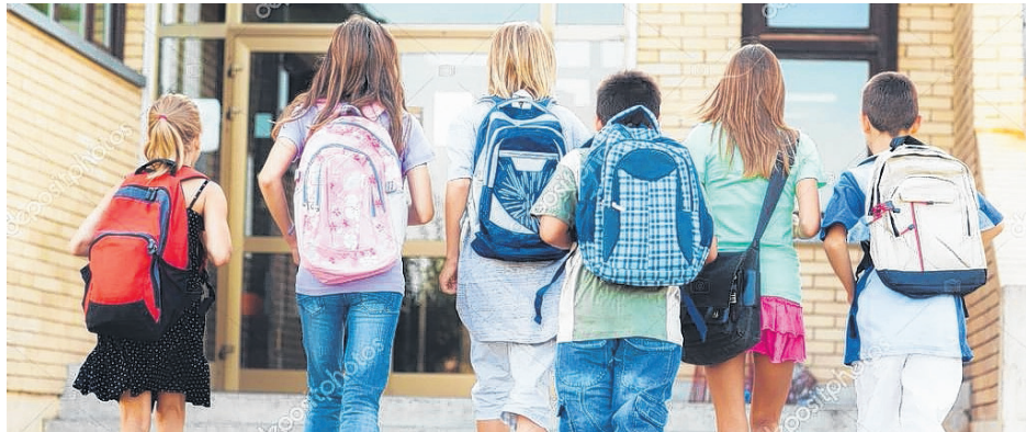
Plus de 4200 élèves se préparent pour la rentrée scolaire à la Commission scolaire René-Lévesque.

Les cours et programmes offerts sont répartis dans 3 centres d'éducation des adultes et 3 centres de formation professionnelle, situés entre Grande-Rivière et Matapédia.