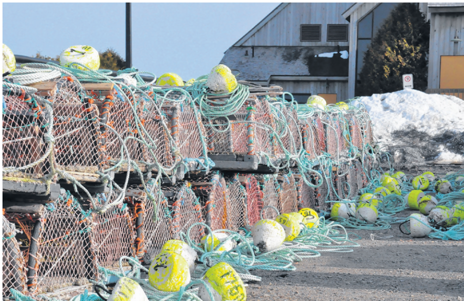
Si tout va pour le mieux, une visée commerciale pourrait se faire d'ici 2021.

« On travaille pour développer un produit équivalent pour le homard. Considérant qu'il n'y a pas d'appât artificiel, pas de cuiller pour le homard ou d'appât solide, on développe aussi ce qu'on appelle la matrice qui agit un peu comme