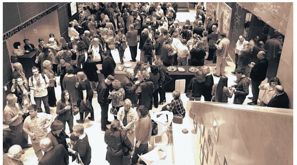
Voici une photo prise lors de la 12 e édition du Cinema on the Bayou à Lafayette en Louisiane.

«Oui, il y aura plusieurs rencontres avec les différents partenaires cet automne dans