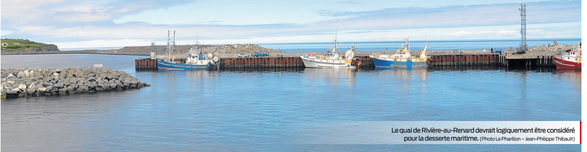
Le quai de Rivière-au-Renard devrait logiquement être considéré pour la desserte maritime.