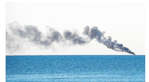
Le bateau de pêche est une perte complète.

Après quelques minutes à bord de ce dernier bateau de pêche, le temps pour le propriétaire du Jeannina 2 d'analyser la situation pour voir si les flammes allaient cesser ou encore diminuer