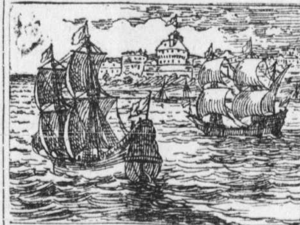
Au printemps de 1534, Jacques Cartier, habile navigateur, quitte Saint-Malo (France), avec deux vaisseaux, pour aller en Amérique à la découverte de nouvelles terres. La traversée fut courte et heureuse.