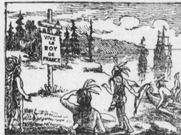
Cartier explore les côtes de Terre-Nouve, traverse le golfe du Saint-Laurent et, au mois de juillet, entre dans une baie considérable qu'il nomme baie des Chaleurs. Puis il pénètre dans le bassin de Gaspe, où il plante une croix portant l'inscription: VIVE LE ROY DE FRANCE. A son retour il amène deux jeunes sauvages pour les faire instruire.