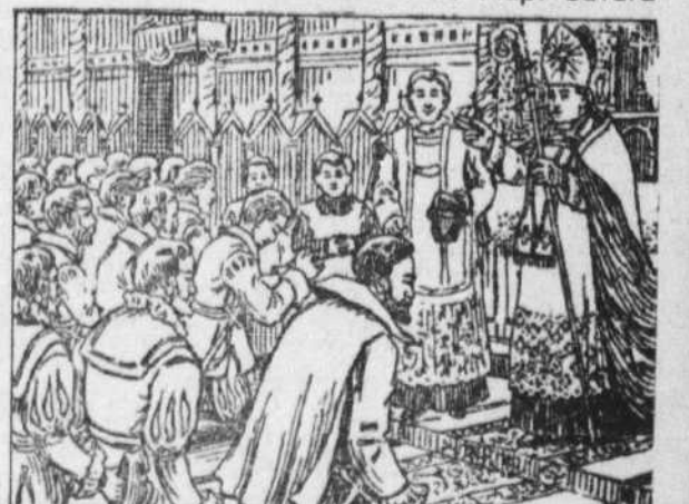
François Ier, roi de France, reçoit le premier voyage de Cartier, l'autorisant à repartir le printemps suivant. Le jour de la Pentecôte, le hardi Breton et son équipage commencent et accomplissent la découverte de l'île de Terre-Nouve, dans le golfe de Saint-Laurent. Ils partent peu après sur trois vaisseaux: la GRANDE HERMINIE, la PETITE HERMINIE et l'EMERILLON.