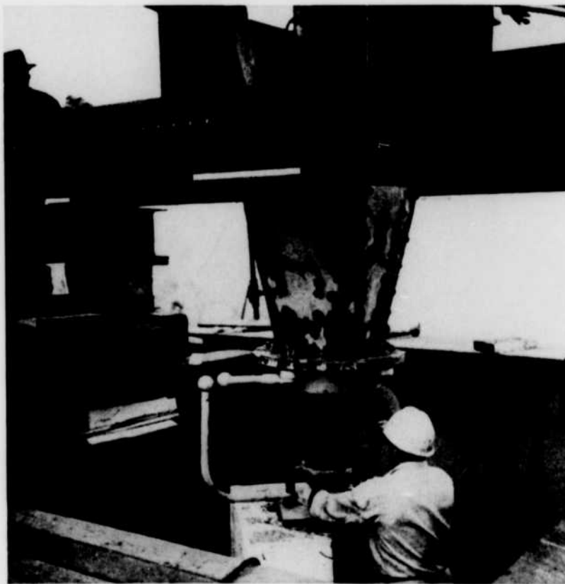
Notre illustration représente la base de la tour qui sert d'antenne au poste CBF à Verchères. Lundi, 5 septembre, les émissions de CBF furent interrompues quelque temps le matin afin de permettre les réparations qui devaient être effectuées à la base de l'antenne : un ouvrier est ici à remplacer l'isolateur de porcelaine dans lequel on avait découvert une fissure.