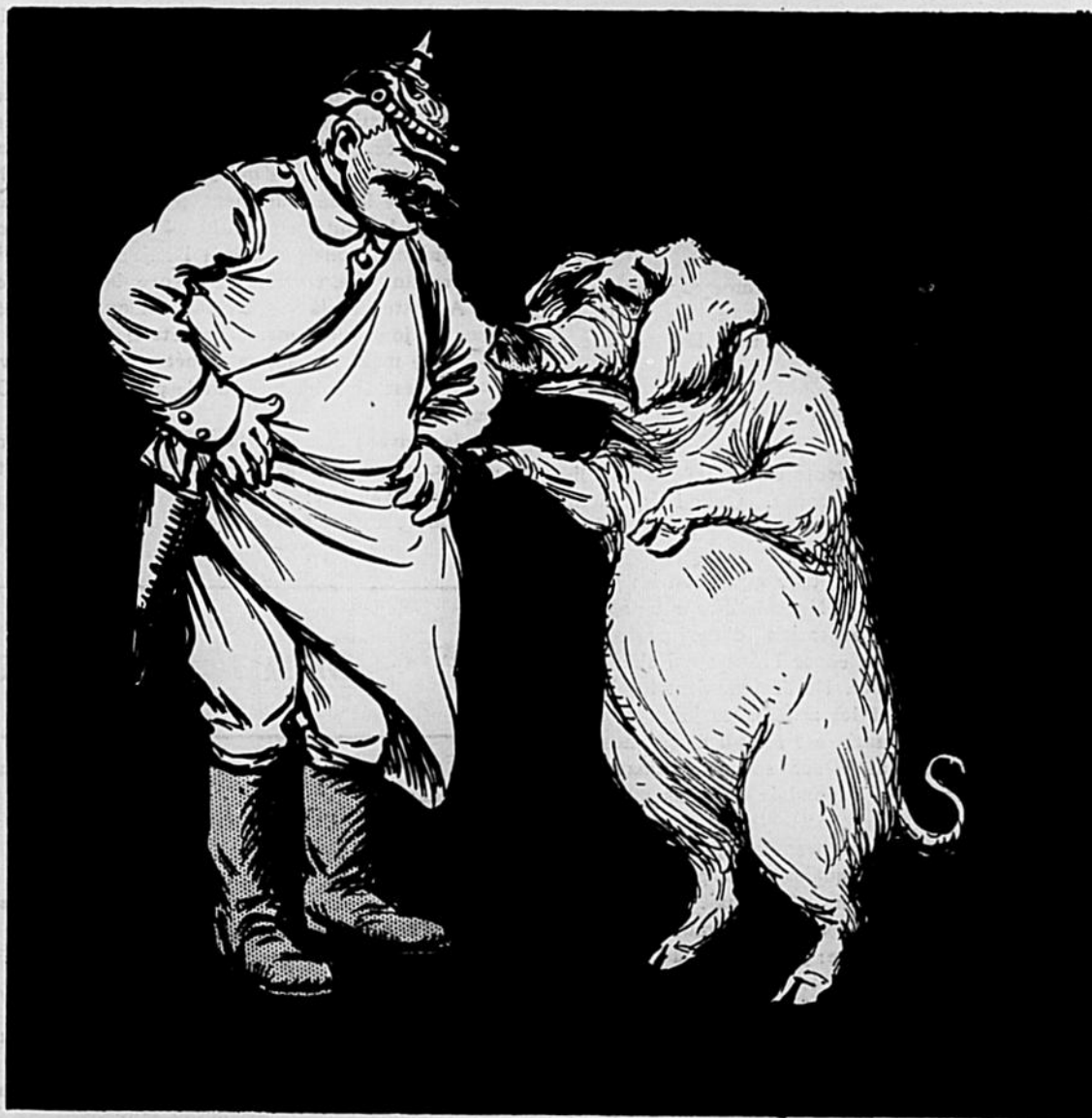
LE COCHON CANAYEN AU BOUCHER BOCHE. — Je viens à toi, ô charcutier teuton, pour te dire que Flavelle nous fait manger par les Allemands et que Borden le laisse faire sous prétexte que ça va lui servir pour son élection. Et pourtant Borden revient de Berlin (Kitchener) un peu "cochonné" par les citoyens de l'endroit.