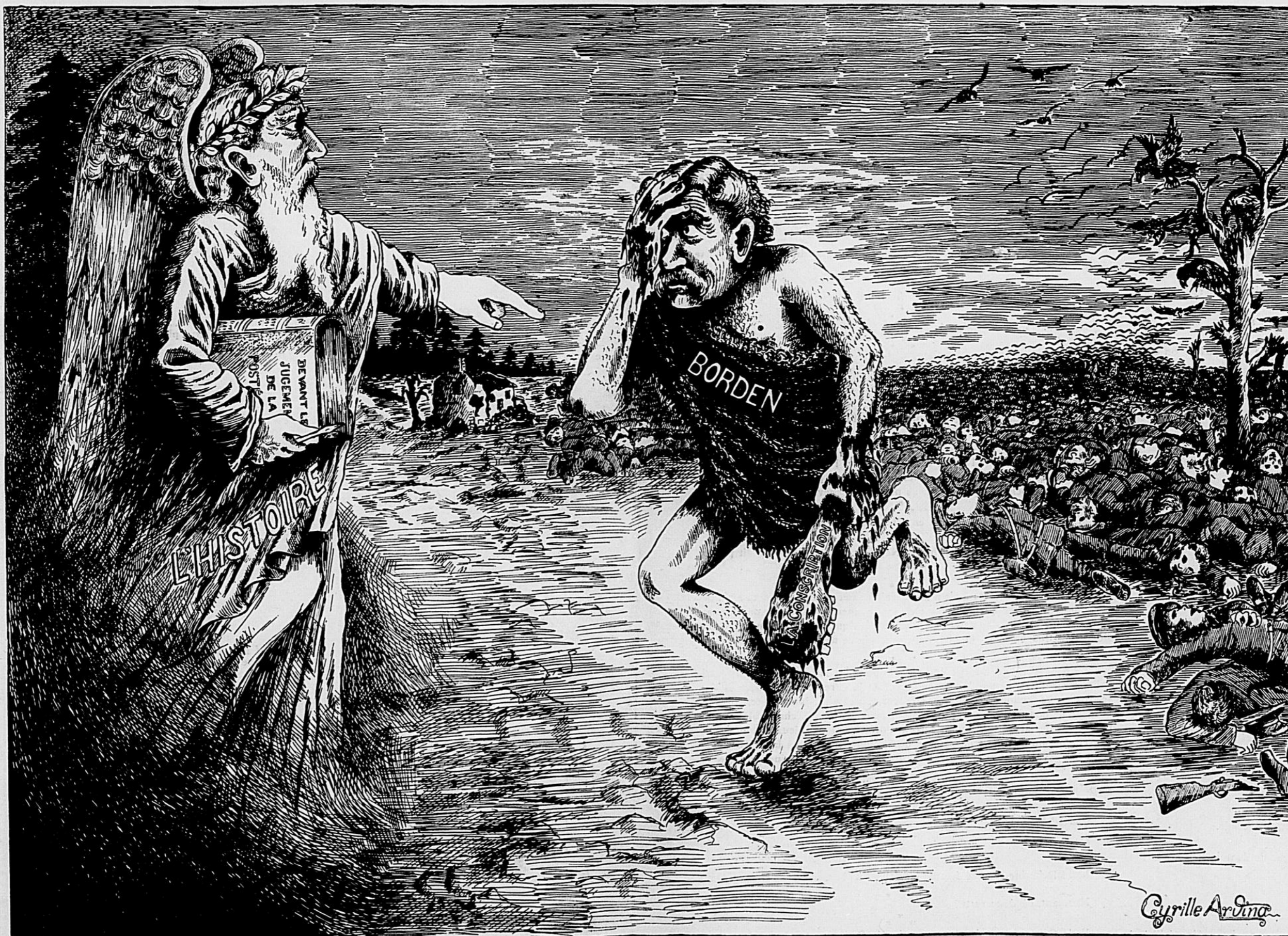
Ce que lui demandera l'histoire : BORDEN... BORDEN...! QU'AS-TU FAIS DE TES FRERES ?