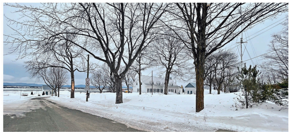
L'avenir du presbytère de Saint-Michel et de l'ensemble de l'ensemble paroissial a fait l'objet d'une vaste consultation citoyenne au cours des dernières semaines.

«C'est important de le mentionner, car il y a certains groupes de personnes qui prennent la liberté d'envoyer des circulaires ou de publier des textes laissant entendre qu'ils seront partenaires avec la municipalité, que leur mission de préservation du presbytère chemine bien, alors que ça ne