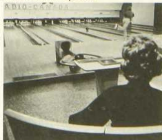
L'Heure des quilles