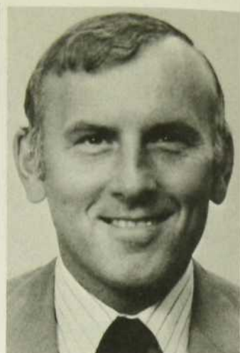
Ralph Edgar Mellanby

De régisseur, il fut promu réalisateur, notamment aux séries "La Soirée du hockey", "Prenez le volant" et "L'Univers des sports". Il a réalisé des reportages aux Jeux Olympiques de Munich, aux rencontres d'athlétisme Canada-Russie et Canada-France, aux Jeux du Québec de Rivière-du-Loup, et à la rencontre d'athlétisme de Montréal 1975. En 1976, Gaston Laporte réalisera les reportages sur les épreuves de pelouse en athlétisme.