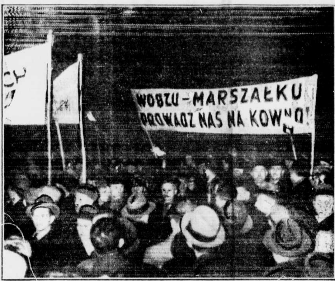
Cette radiophoto montre une foule délirante de Polonais en parade, réclamant une intervention énergique contre la Lithuanie, à la suite de l'ultimatum que le gouvernement de Varsovie envoya à son voisin en exigeant sa reconnaissance de Wilno (Vilna) comme ville polonaise.