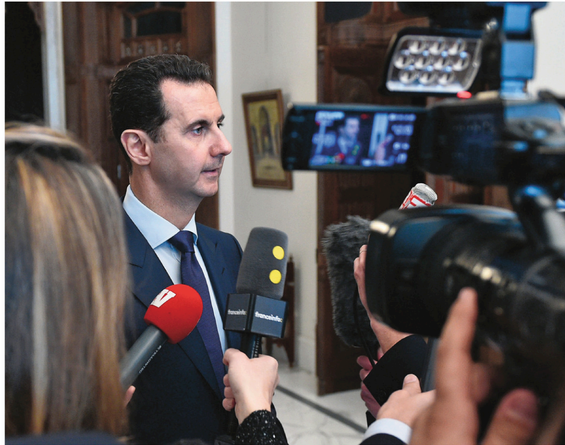
Le président syrien, Bashar al-Assad, a accordé des entrevues à certains médias français, ces derniers jours, dans lesquelles il évoque le cours de la guerre et les négociations avec l'opposition.