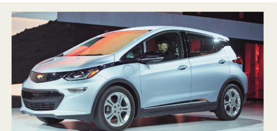
GEOFF ROBINS AGENCE FRANCE-PRESSE