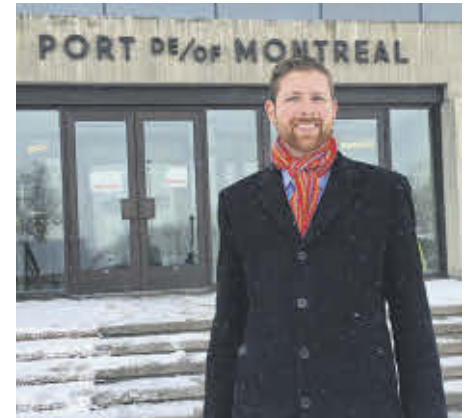
Le député Xavier Barsalou-Duval se réjouit des conclusions du rapport.

« Outre le plan complet de mesures de compensation et d'atténuation soumises à l'Agence, l'APM s'engage à continuer à travailler étroitement avec cette dernière et les différentes autorités concernées, ainsi que les Premières Nations, afin d'avoir un impact minimal sur les écosystèmes humain, aquatique et terrestre », poursuit l'APM.