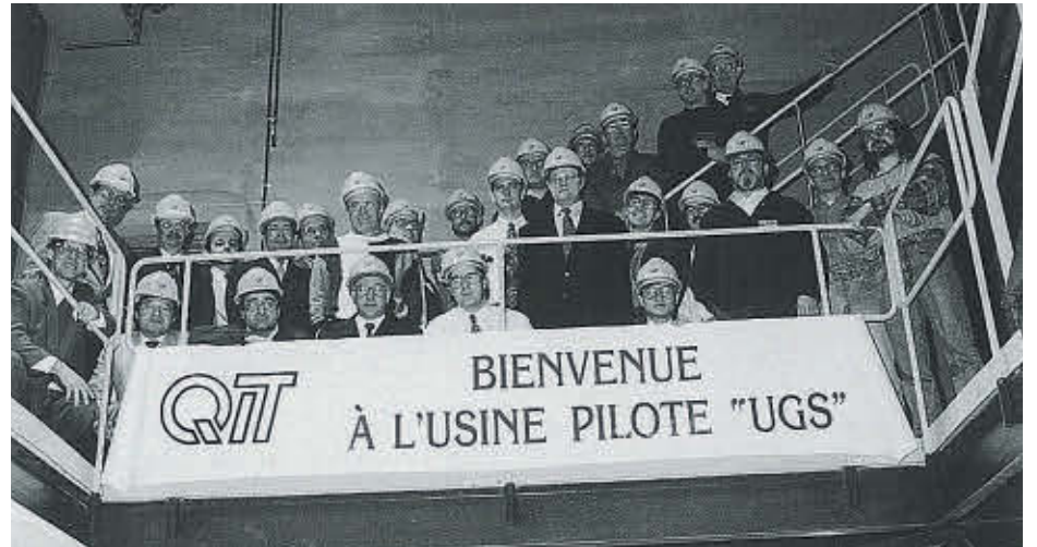
L'usine UGS de Rio Tinto a été inaugurée en 1996, un fait marquant des 70 dernières années.