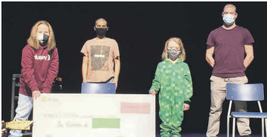
Cinq personnes se sont fait raser les cheveux à l'École secondaire Fernand-Lefebvre afin d'amasser des fonds pour la Société canadienne du cancer.

La neuvième édition du Défi cocos rasés, qui s'est déroulée le 17 novembre à l'École secondaire Fernand-Lefebvre (ESFL), avait pour objectif d'amasser 1000 $ pour la Société canadienne du cancer. C'est finalement un montant de 3839 $ qui a été récolté.