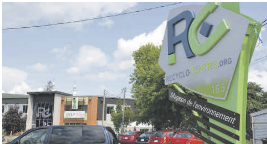
Le Recyclo-Centre fait partie des organismes ayant déposé un projet dans le cadre des BIEC.

Le Centre des arts contemporains du Québec à Sorel-Tracy a déposé le projet Virtu-Art, une plateforme numérique interactive. Le projet consiste en l'implantation d'une solution sur mesure et hautement performante pour la mise en place d'une plateforme Web de gestion et de commerce électronique élaborée multicanale afin d'augmenter la visibilité.