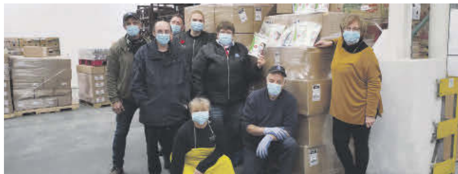
Les Banques alimentaires du Québec ont reçu 900 000 masques qui ont été distribués aux 19 membres Moisson de la province.