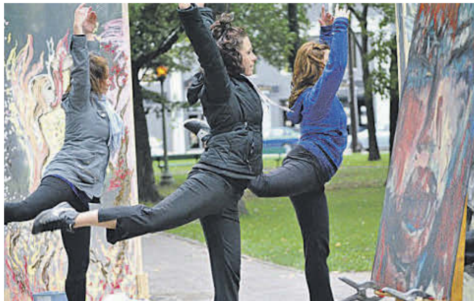
La Ville de Sorel-Tracy signera une entente triennale de développement culturel avec le ministère de la Culture et des Communications.

La fermeture du boulevard Cournoyer à certains moments de la journée sera finalement prolongée. La mesure permet aux jeunes de l'École Saint-Jean-Bosco de bénéficier de plus d'espace extérieur lors des récréations en temps de pandémie. La suspension de la circulation est en vigueur seulement les jours de classe. La fermeture est conditionnelle à certains aménagements physiques comme l'installation de clôtures amovibles fournies par l'école. La décision sera révisée en temps et lieu, selon l'évolution de la crise sanitaire. Rappelons que le