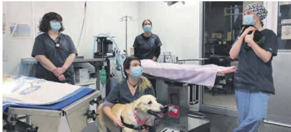
La SPCA de Montréal a reçu 100 000 masques de FORMEDICA ET JD Anima.