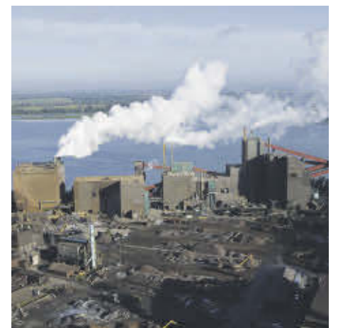
Le complexe métallurgique de Rio Tinto à Sorel-Tracy, vu des airs en 2012.

L'entreprise affirme que les dons ne sont pas terminés et que d'autres actions seront annoncées dans les prochaines semaines.