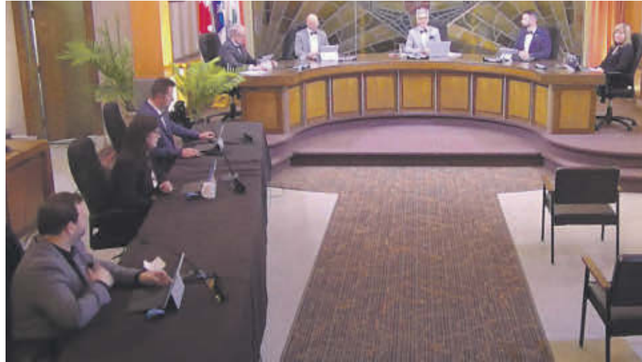
Les salaires du maire et des conseillers de Sorel-Tracy ont été augmentés selon l'IPC en 2020.

En mars dernier, 90 employés de la ville avaient temporairement été mis au chômage. Le maire s'est dit conscient de l'année difficile vécue et c'est pourquoi il a proposé ce gel des salaires des élus pour 2021. Il affirme que