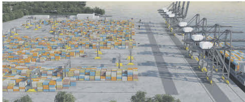
Le projet d'expansion du Port de Montréal a franchi une étape importante avec le rapport de l'Agence d'évaluation d'impact du Canada.

L'Agence conclut également que le projet, combiné aux projets passés, présents et raisonnablement prévisibles, n'est pas susceptible d'entraîner des effets environnementaux cumulatifs sur les milieux