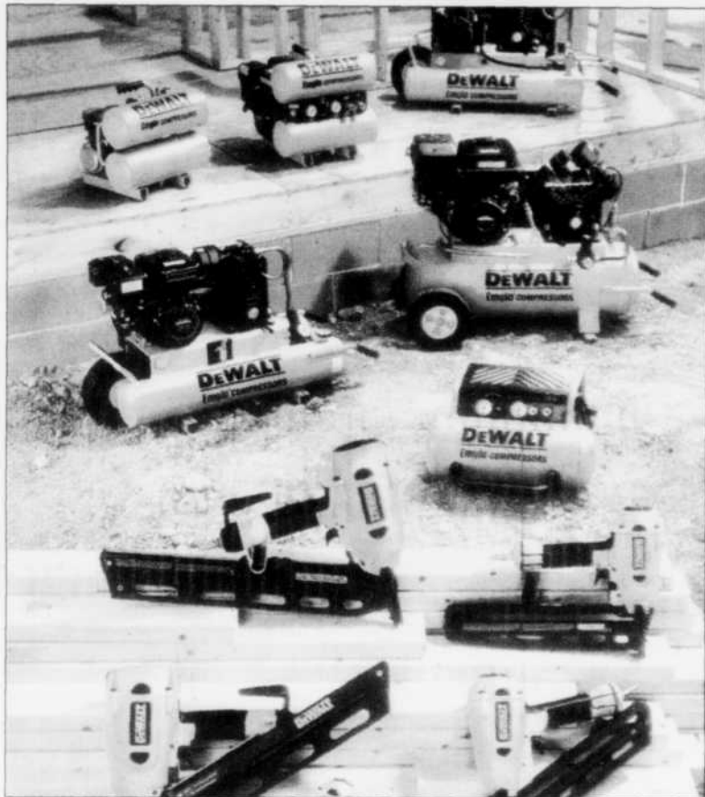
OUTILS - La nouvelle gamme de compresseurs d'air DeWalt comprend six modèles différents.

La compagnie DeWalt a lancé dernièrement une nouvelle gamme de compresseurs d'air comprenant six modèles différents pour les utilisateurs spécialisés. On y trouve des modèles électriques ou à essence, à réservoir et débit d'air variés et en modèle portatif ou sur roue (type brouette). Les réservoirs, dont la capacité se situe entre 4 et 17 gallons, comprenant des robinets de vidange à billes qui assurent une vidange rapide et efficace. DeWalt a mis au point sa propre gamme de compresseurs d'air en collaboration avec Emglo Corporation, le chef de file de l'industrie dans le domaine des compresseurs d'air, dont DeWalt a fait l'acquisition l'an dernier.