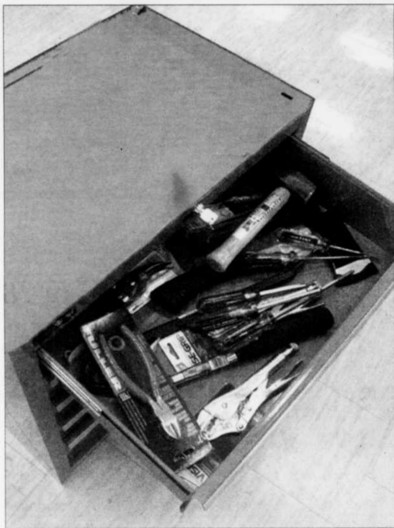
COFFRE D'OUTILS - Les propriétaires de maison ont besoin de plus en plus d'outils pour réaliser eux-mêmes les travaux de rénovation.

Une boîte à outils bien équipée est facile à réaliser et fait souvent toute la différence lorsqu'il s'agit de faire un bon travail. D'ailleurs, ce sont des cadeaux parfaits pour une crémaillère, une collation de grade