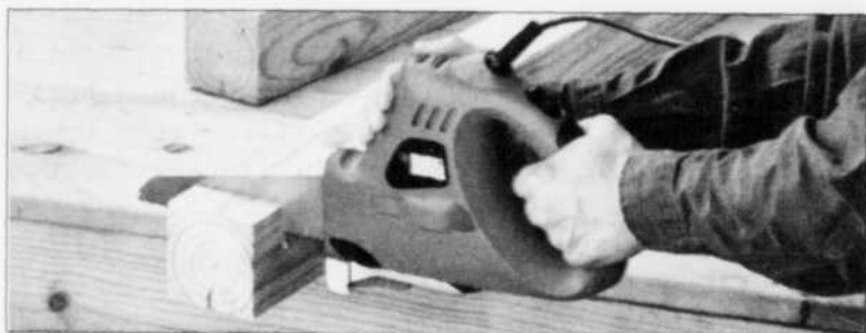
SCIE - La scie Navigator est conçue comme une scie à main traditionnelle.

La scie à main se transforme en scie sauteuse en quelques secondes, sans aucun autre outil, il suffit de lui installer la lame de scie sauteuse spécialement conçue à cet effet. Dans sa version scie sauteuse, la Navigator permet de couper et de tourner des pièces arrondies ou contrées.