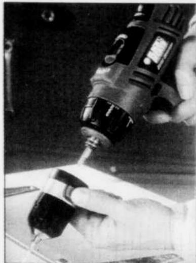
PERCEUSE - Le système de changement d'embout Quick Connect est très pratique.

La compagnie Black & Decker a lancé, dernièrement, la seconde génération de ses populaires perceuses sans fil, haute performance, Fire Storm avec de nouvelles caractéristiques jamais vues auparavant et qui augmentent la performance et facilitent la manipulation.