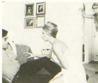
On s'fait la valise, docteur?