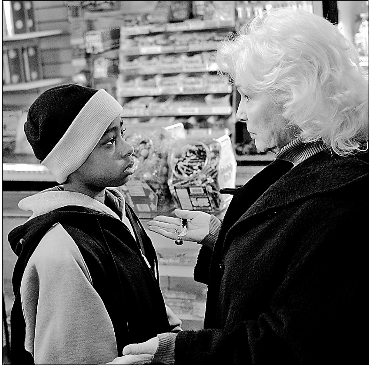
Plus que par son histoire, Four Brothers séduit d'abord par son style. Dans cette scène, Evelyn Mercer tente de dissuader le jeune Darnell de faire du vol à l'étalage.

Cela dit, Mark Wahlberg, André Benjamin, Tyrese Gibson et Garrett Hedlund offrent tous des performances honorables.