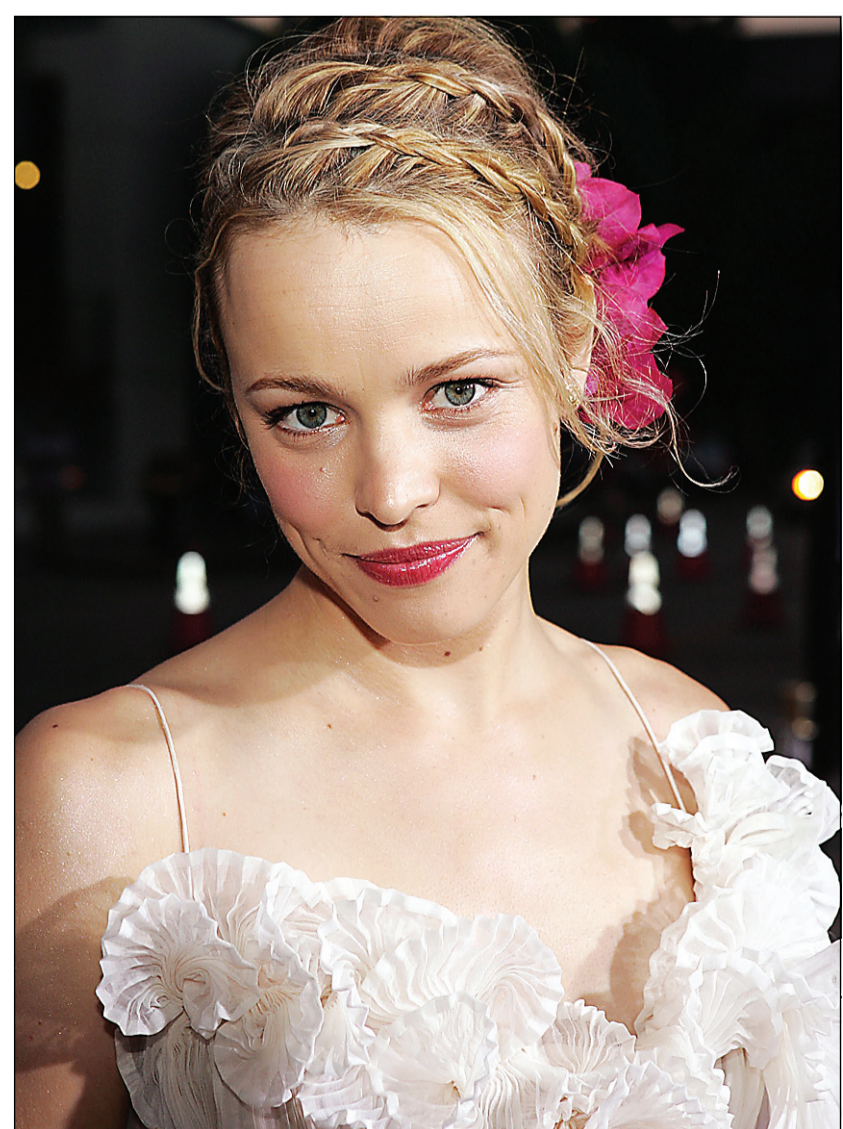
« J'aime jouer des personnages dont la force intérieure n'est pas apparente d'emblée », explique l'actrice canadienne Rachel McAdams.

Rachel McAdams fait par ailleurs partie de la distribution de The Family Stone , une comédie romantique (à l'affiche en novembre) dans laquelle elle donne notamment la réplique à Diane Keaton, Sarah Jessica Parker, Claire Danes et Luke Wilson.