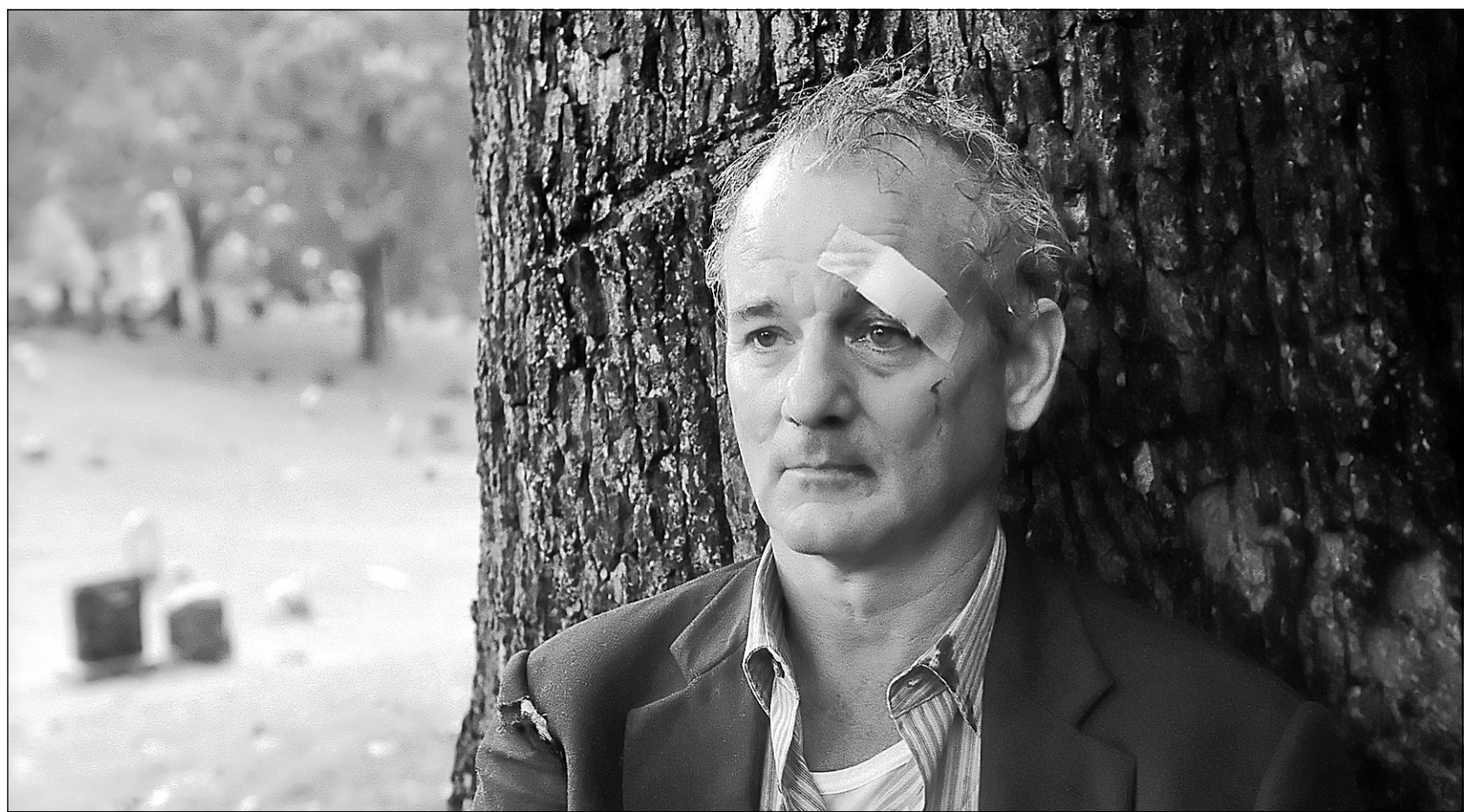
Broken Flowers met en vedette un Bill Murray en grande forme dans le rôle de Don Johnston, un Don Juan blasé et impénitent qui se laisse convaincre par son voisin de partir à la recherche de la mère de son fils présumé de 19 ans.

Broken Flowers met en vedette un Bill Murray en grande forme dans le rôle de Don Johnston, un Don Juan blasé et impénitent qui, après avoir reçu une mystérieuse lettre anonyme, se laisse convaincre par son voisin Winston (excellent Jeffrey Wright) de partir à la recherche de la mère de son fils présumé de 19 ans. Il croisera sur sa route plusieurs anciennes flammes, autant de prétextes à des situations cocasses qui le pousseront à une réflexion sur sa vie