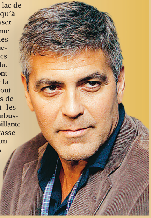
George Clooney