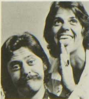
Thème: «Création». Réal.: Michel Gaumont.