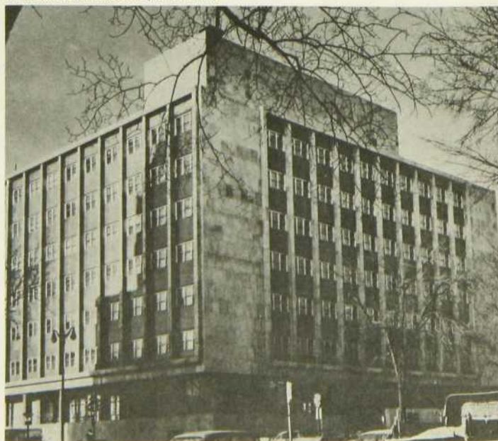
La Galerie nationale, à Ottawa