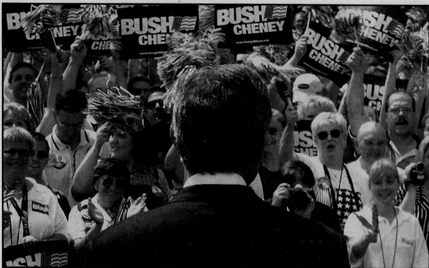
Avant de se rendre à Philadelphie où il sera couronné demain, George W. Bush a fait campagne hier en Virginie.