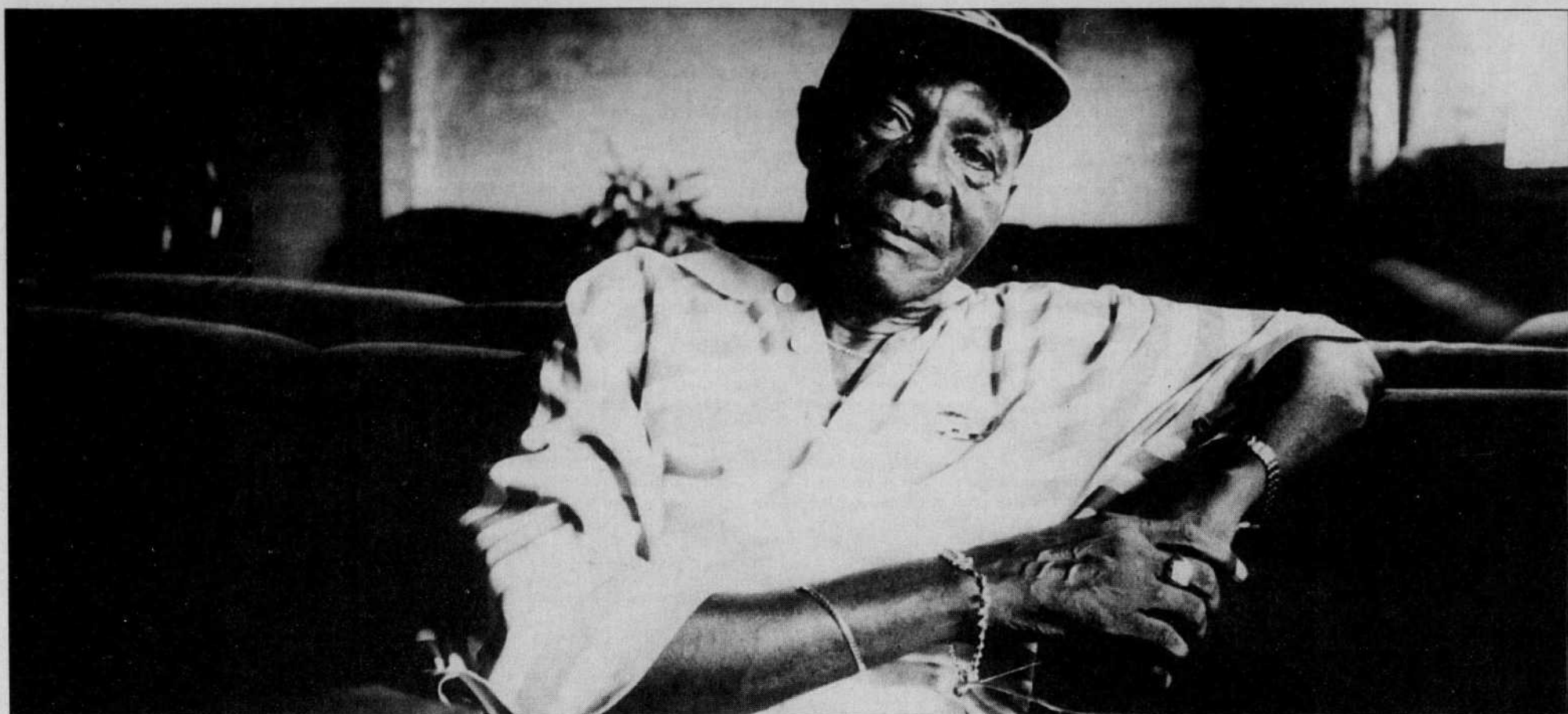
Originaire du Congo/Zaïre, Wendo Kolosoy donnera un spectacle au parc Hydro-Québec, à 22h.

L'Afrique aux 12 es FrancoFolies de Montréal