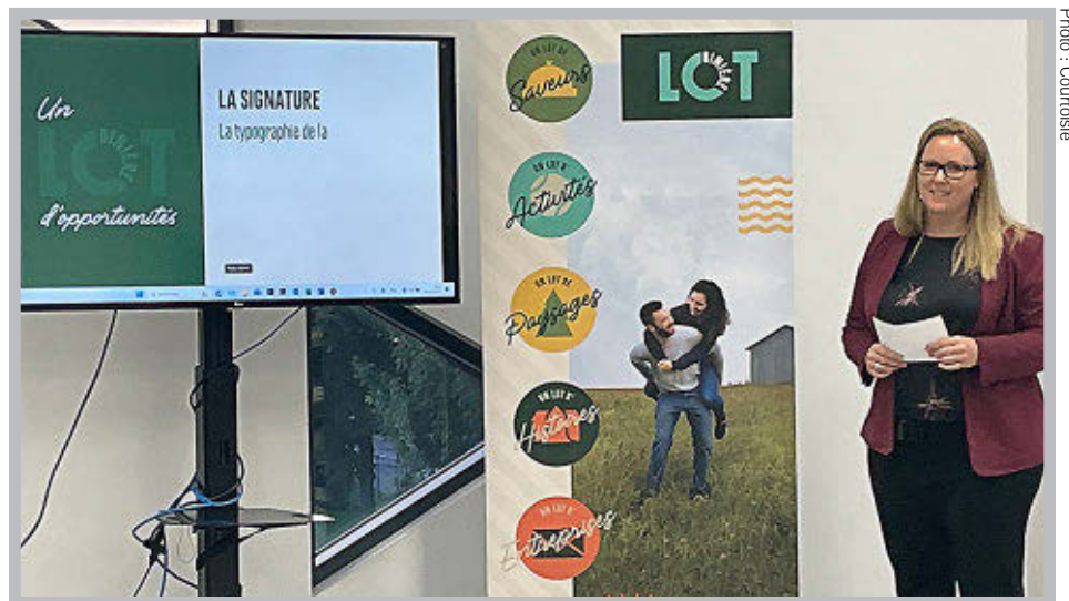
» Le mot «Lot» est mis à l'avant plan dans la nouvelle image de marque de la MRC de Lotbinière.

La nouvelle image de marque de la MRC pourra également se décliner en différentes thématiques, soit le «lot de saveurs» pour présenter l'offre gourmande, le «lot d'histoires» pour présenter l'offre historique et patrimoniale, le «lot d'activités» pour présenter l'offre d'activités et de sports, le «lot de paysages» pour présenter l'offre territoriale et le «lot d'entreprises» pour présenter l'étendue des possibilités entrepreneuriales. «C'est avec beaucoup de fierté que l'on vous dévoile la nouvelle